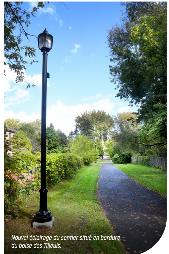
Nouvel éclairage du sentier situé en bordure du boisé des Tilleuls.