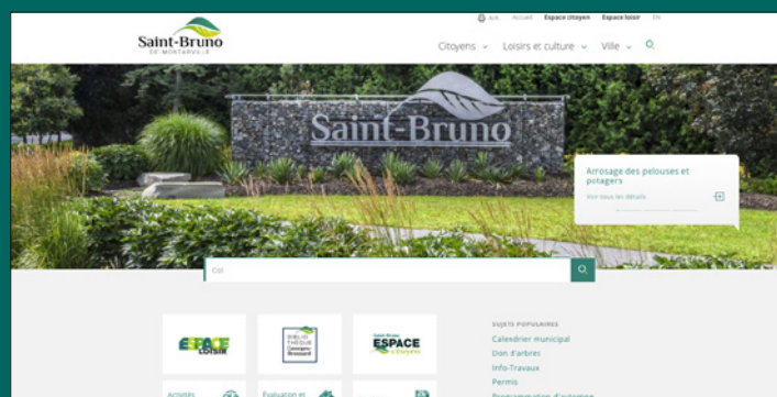
Refonte de la page d'accueil du site Web pour une expérience utilisateur optimisée et une navigation mieux adaptée à la consultation sur cellulaires.