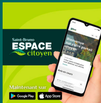
Lancement de l'application mobile de l'Espace citoyen Saint-Bruno pour des services aux citoyens regroupés et facilités, et pour faire des signalements à la Ville