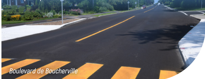
Boulevard de Boucherville

Le conseil a fait une priorité de l'amélioration de l'état des rues pour tous les usagers afin de rattraper le retard constaté. Un rapport d'auscultation des rues par une firme spécialisée, réalisé en 2024, a souligné l'amélioration colossale de l'état des rues à Saint-Bruno. La Ville a repavé plus de 4630 mètres linéaires cette année.