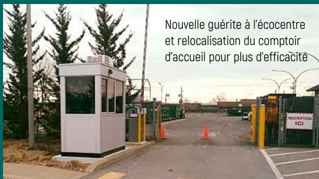
Nouvelle guérite à l'écocentre et relocalisation du comptoir d'accueil pour plus d'efficacité