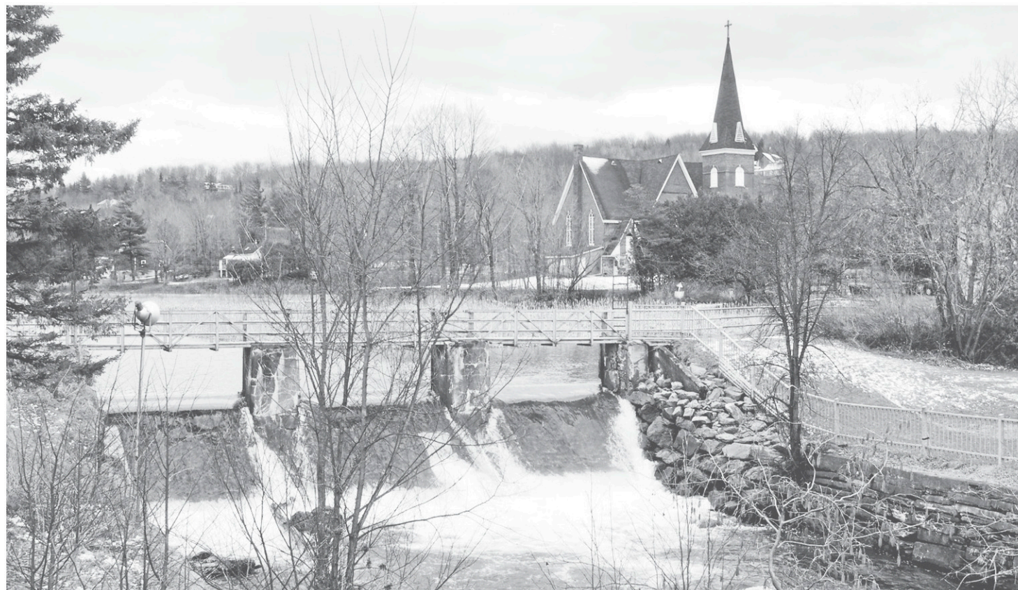
Le barrage Blackwood.

La Fédération canadienne des municipalités est l'autre partenaire de la Ville. Elle versera une subvention de 120 000 $ pour réaliser tous ces travaux.