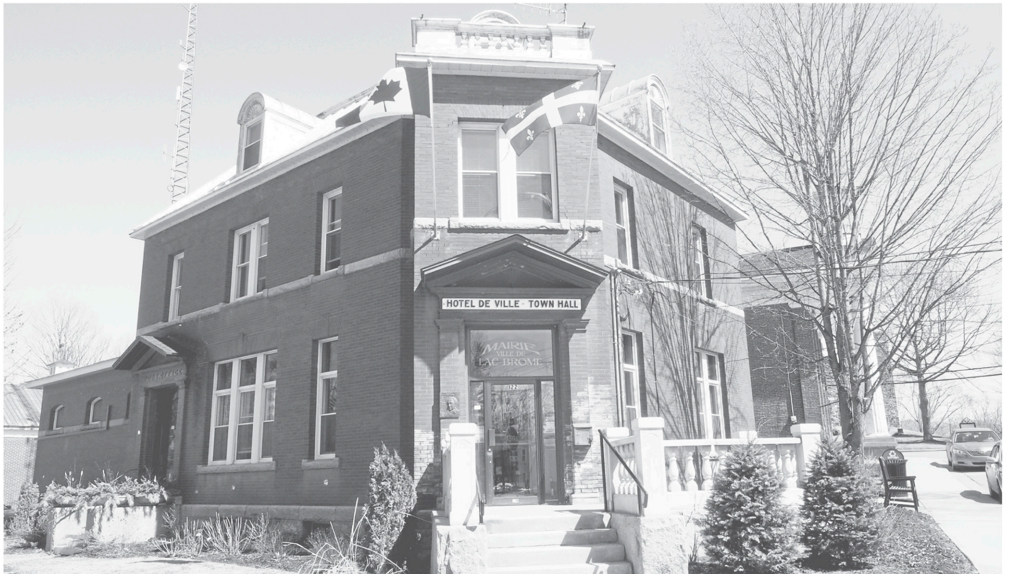
Lac-Brome fait partie de la poignée de municipalités qui détient le statut de ville bilingue, alors que les francophones et les anglophones sont pratiquement à parité.