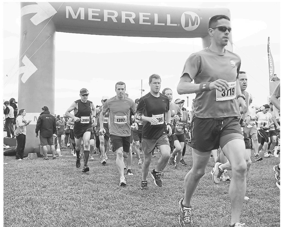
Le Tour du lac Brome célébrera ses 37 ans lors du week-end des 12, 13 et 14 juin prochains.

On peut s'inscrire à l'une des nombreuses courses via le site Internet de l'organisation au www.tourdulacbrome.com