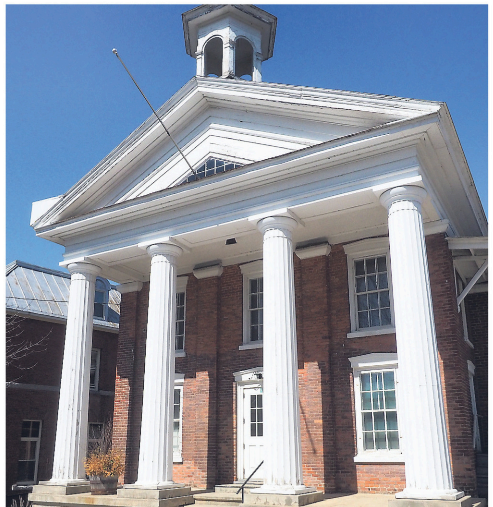
L'ancien palais de justice fait partie des bâtiments historiques de la Ville.