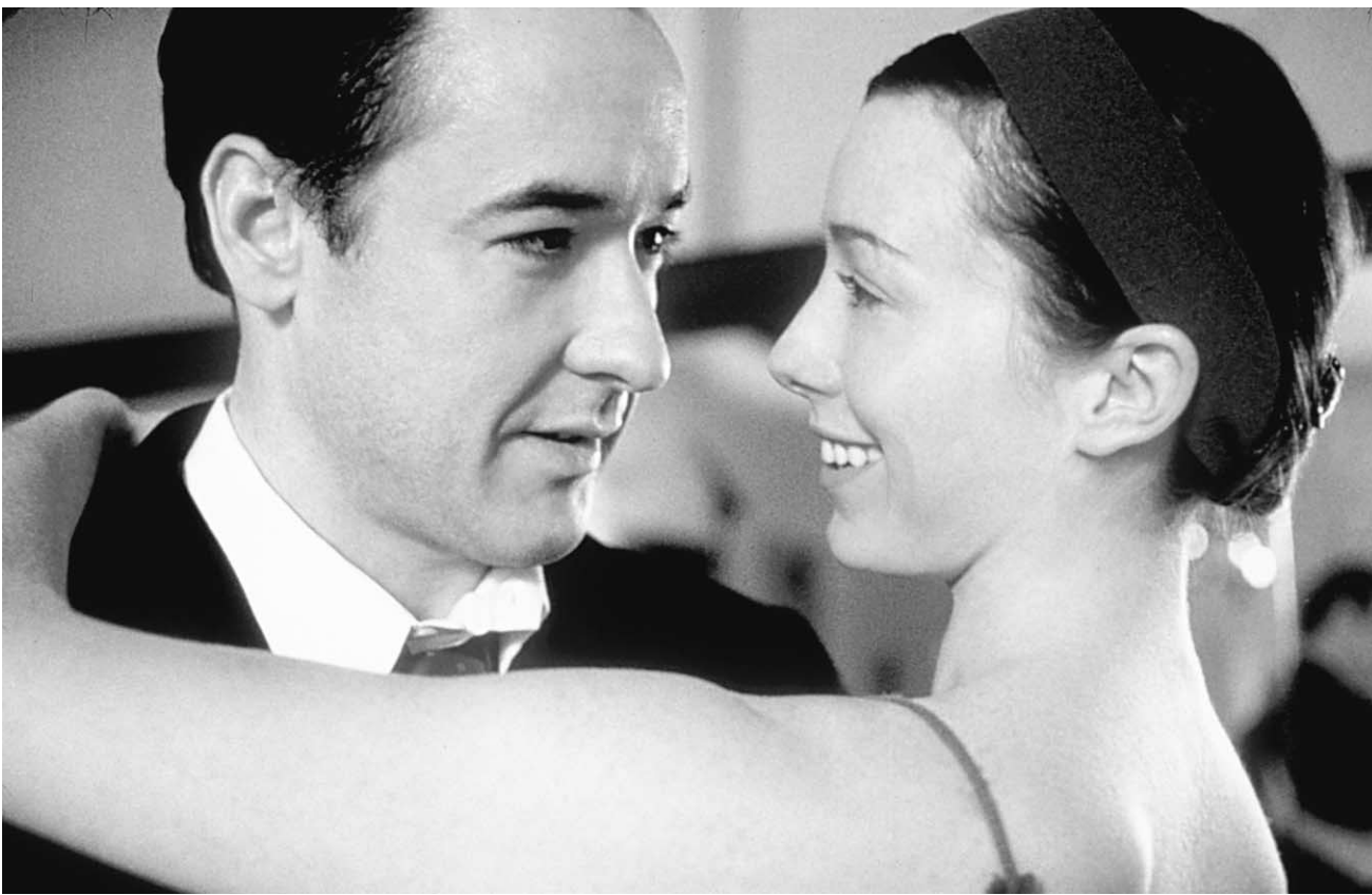
John Cusack et Molly Parker dans Max .

Le pari est bien tenu. Dans la mesure où Meyjes oppose l'effulgence artistique de l'époque (naissance de l'art moderne, du mouvement dadaïste, du surréalisme) à la conception traditionnelle d'un artiste trop moyen qui choisira finalement l'art oratoire et la politique pour canaliser sa rage.