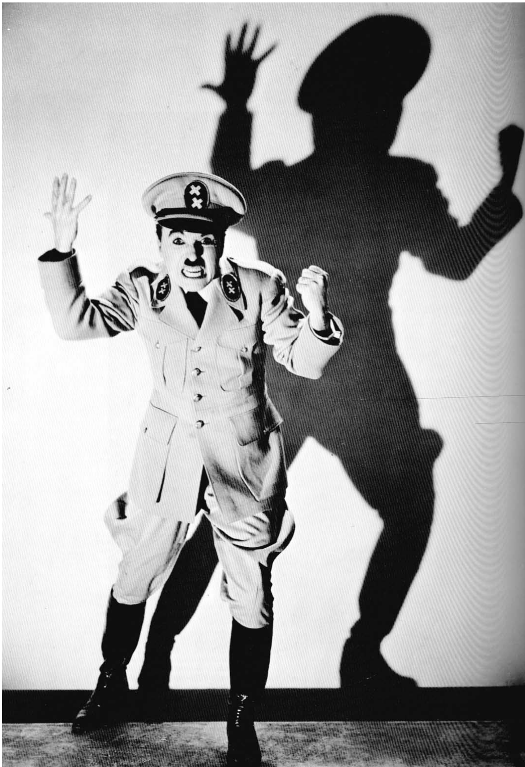
On peut avancer que Chaplin avait choisi de jouer Hitler à cause des prédispositions burlesques du personnage. Peut-être a-t-il aussi voulu torde le cou au nazi qui sommeillait en lui, comme en chacun de nous.

Chaplin a mis deux ans à écrire son scénario. « Si j'avais connu les réelles horreurs des camps de concentration allemands, a-t-il soutenu, je n'aurais pas pu réaliser Le Dictateur . Je n'aurais pas pu tourner en dérision la folie homicide des nazis. Mais j'étais décidé à ridiculiser leur bla-bla mystique sur les races au sang pur. Comme si une chose pareille