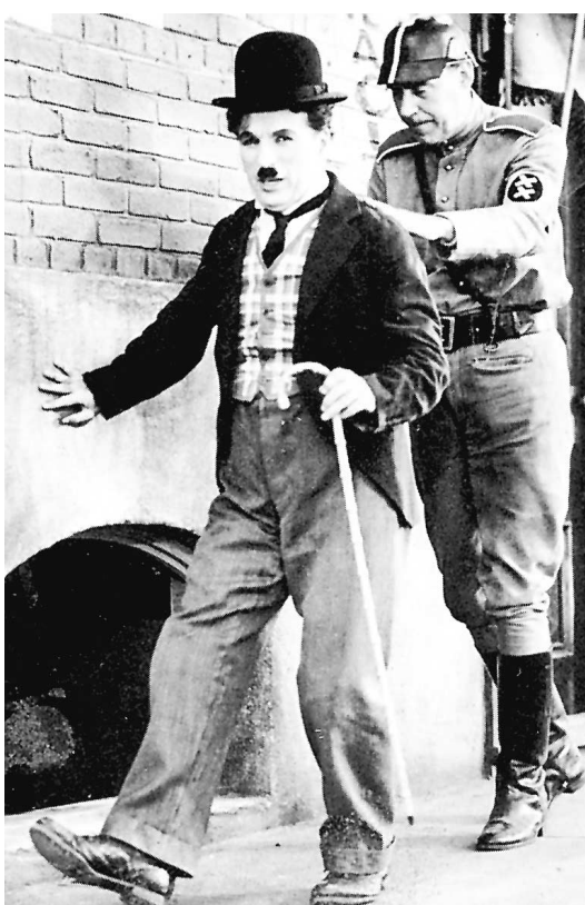
Charlot, plus gentil que jamais en barbier juif qui fait les frais de la dictature.

avait jamais existé en dehors des aborigènes d'Australie ! »