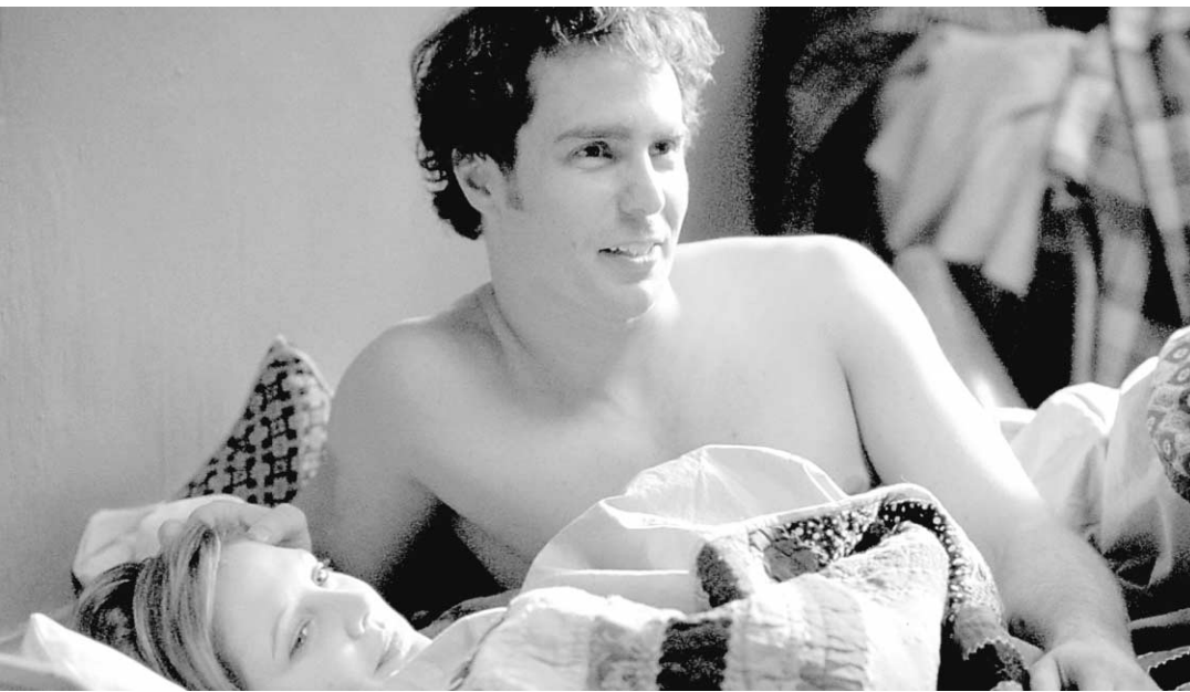
Confessions of a Dangerous Mind : fiction pure ou vraie biographie ?

C'est à Montréal que, pour ses débuts derrière la caméra, l'acteur George Clooney a planté les principaux décors de Confessions of a Dangerous Mind , reprenant tel quel le titre de Barris. Il ne s'est réservé que le rôle discret de Jim Byrd, son mentor. Représentant de la CIA, il recrute Barris dans un premier temps, veille à sa formation, puis l'envoie assassiner à Helsinki ou à Berlin-Est — curieusement reconstitués dans le Vieux-Montréal — des inconnus dont on ne saura à peu près rien sinon qu'il devait les éliminer. C'est à l'occa-