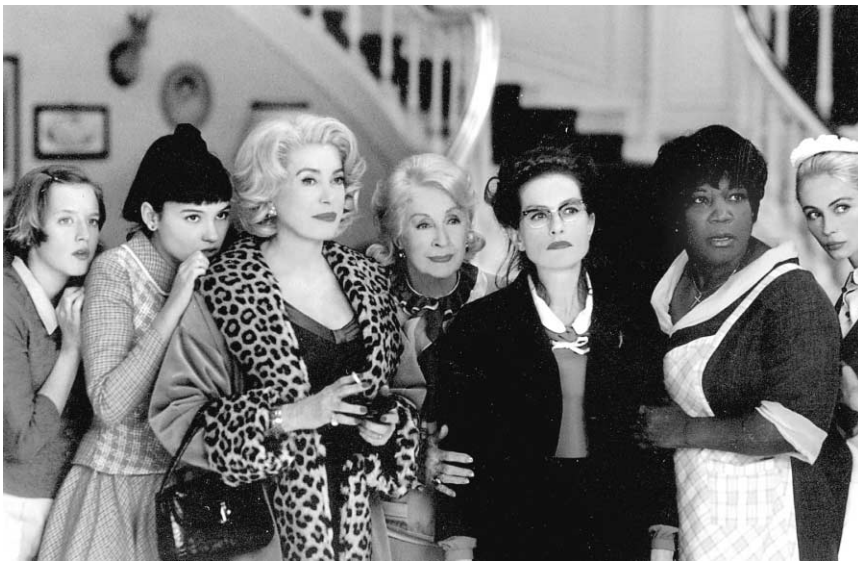
En s'y prenant à huit, les femmes de François Ozon auront-elles l'avantage sur Le Pianiste de Roman Polanski ?

Les interprètes en lice pour le César de la meilleure actrice sont Fanny Ardant ( Huit femmes ), Ariane Ascaride ( Marie-Jo et ses deux amours ), Juliette Binoche ( Décalage horaire ), Isabelle Carré ( Se sou-