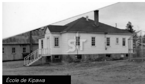
École de Kipawa

L'industrie forestière est à l'origine des débuts de Kipawa en raison de l'abondance de pins blancs et rouges. La Compagnie de la Baie d'Hudson fut la première à s'installer dans les environs vers les années 1850. À cette époque, une vingtaine de compagnies forestières œuvrent autour du lac Kipawa, et elles se multiplient dès l'arrivée du chemin de fer (1880). L'appellation Kipawa a d'abord permis