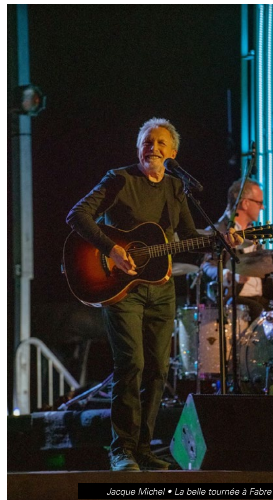
Jacques Michel • La belle tournée à Fabre

Pour conclure, le groupe Kain a aussi fait un petit clin d'œil au Témiscamingue en 2014! En effet, le groupe était en représentation au Théâtre du Rift et a profité de sa présence chez nous pour prendre des images qui serviront plus tard au vidéoclip de la chanson La bonne Franquette .