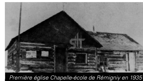
Première église Chapelle-école de Rémigny en 1935

Rémigny est la municipalité la plus au nord du Témiscamingue. Le canton de Rémigny a été proclamé en 1920, mais les premiers colons, une soixantaine en provenance de Joliette, s'y installent en 1935 à la suite du plan de colonisation Vautrin, une initiative conçue pour lutter contre les ravages de la crise économique de 1929. Le nom choisi pour ce territoire rend hommage au capitaine Luc-Angé-