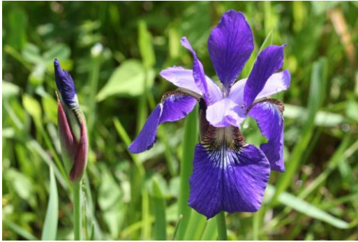
Le Club Iris Espace pour la Vie Jardin botanique de Montréal et son site web