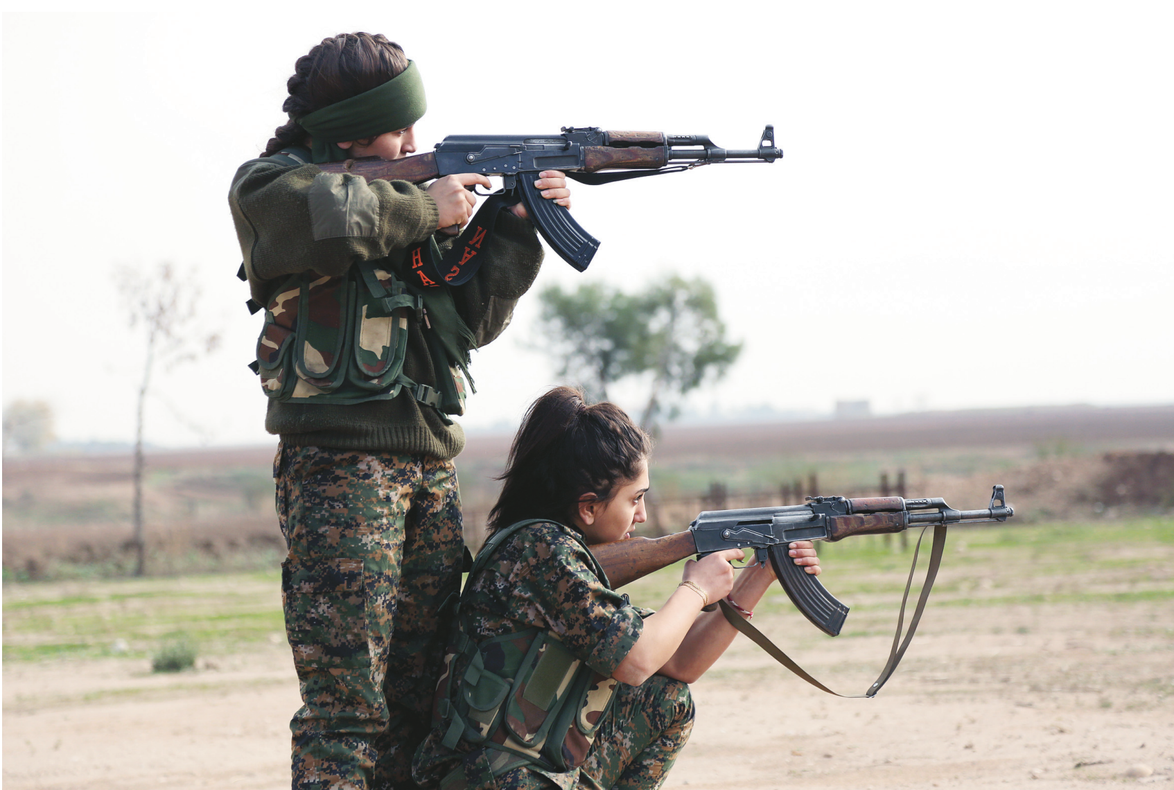
Les femmes suivent des entraînements militaires, sportifs et académiques pour résister à la tension des combats et manier les armes.