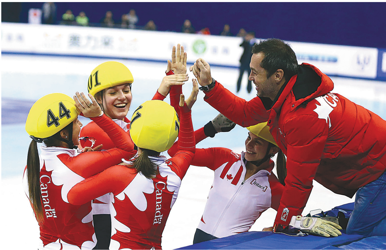
L'équipe canadienne des femmes célébrant une médaille au relais