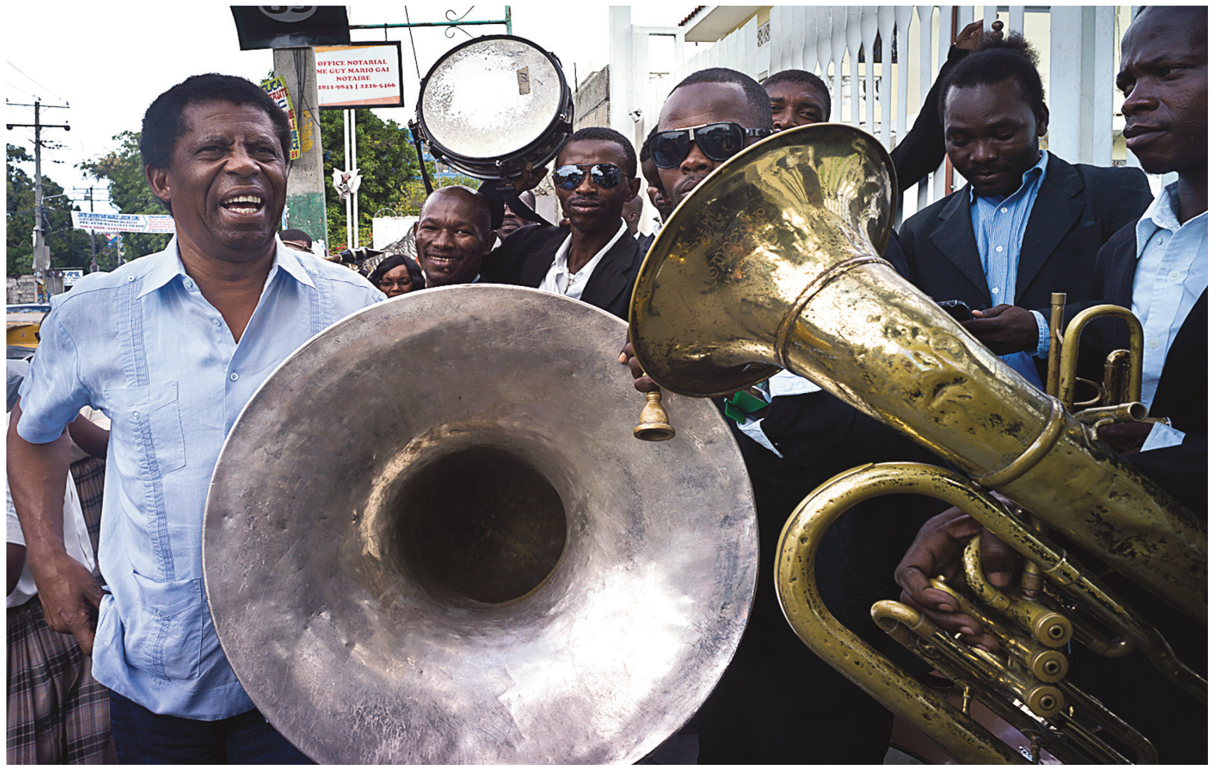
Immense vedette locale et figure de proue malgré lui de cette délégation d'une douzaine d'écrivains québécois, Dany Laferrière ne peut se déplacer dans les rues de Port-au-Prince sans susciter l'enthousiasme.