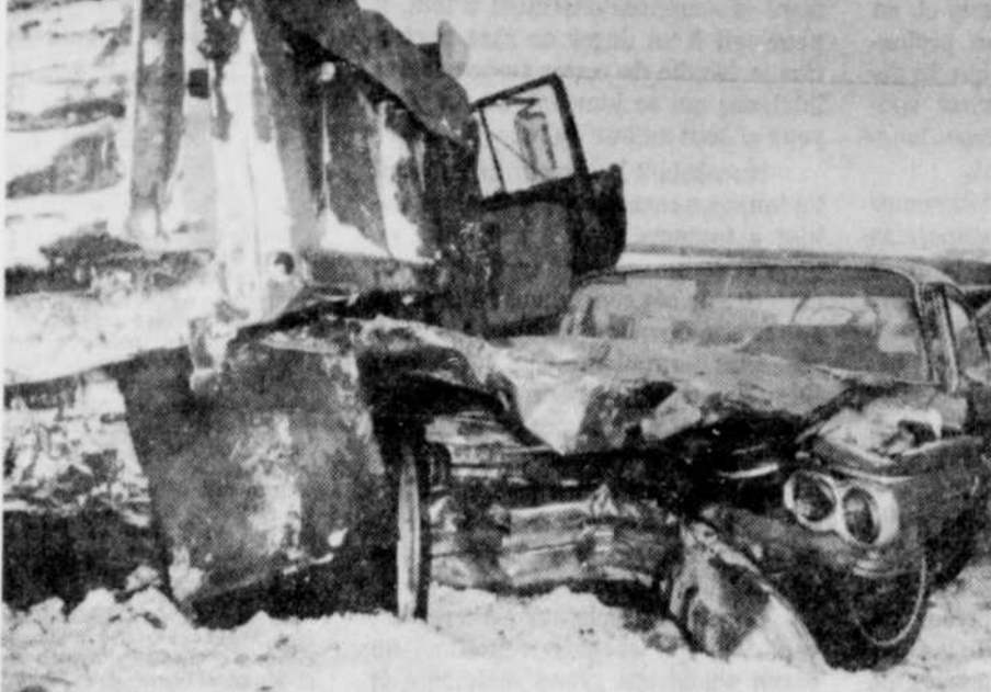
L'AUTO A ETE LOURDEMENT endommagée, lorsqu'elle a heurté un camion poussant une charrue, à l'arrière.