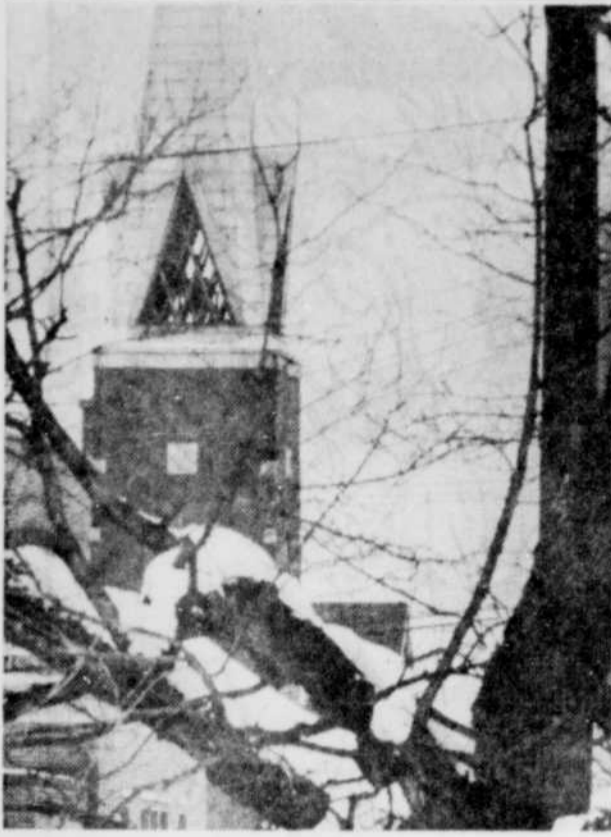
ST-ANTOINE DE LENNOXVILLE — Les gens de Lennoxville ont-ils déjà vu un jour le clocher de l'église St-Antoine de Lennoxville à travers la lentille d'un poète?