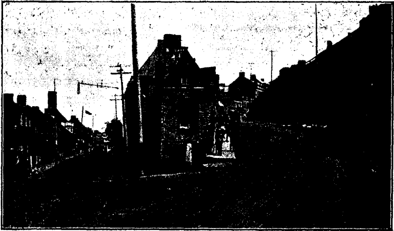
QUÉBEC : CÔTE D'ABRAHAM

La maison habitée par la famille est située dans le quartier de la Côte d'Abraham; elle se compose d'un rez-de-chaussée, surmonté d'un