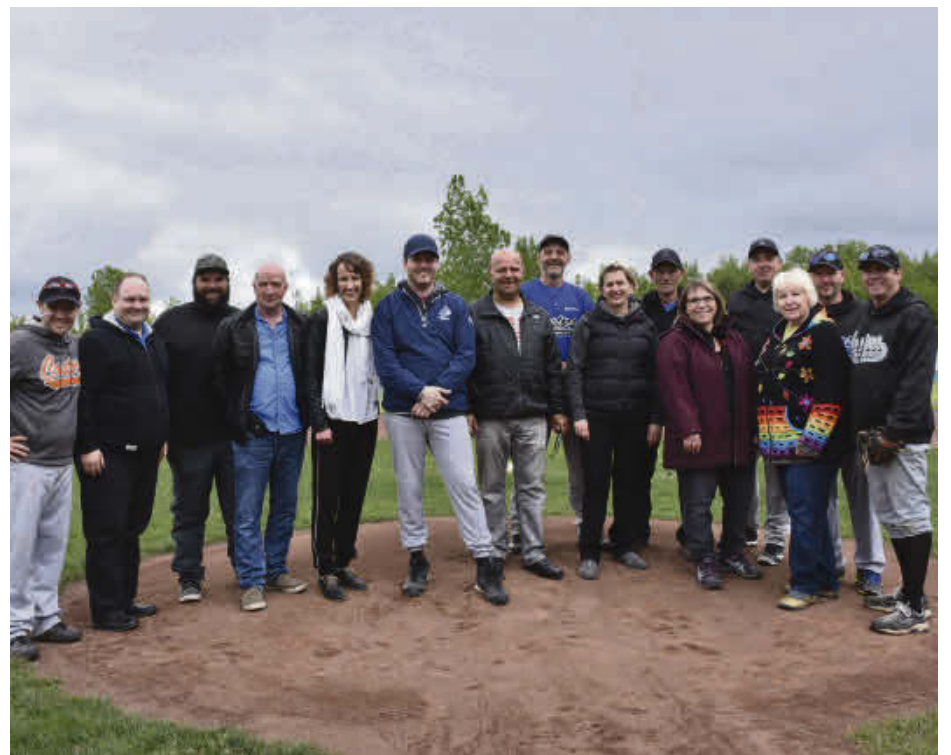
Plusieurs commanditaires et partenaires financiers se sont joints à l'équipe de l'ABMRA pour lancer officiellement la saison 2017.

« Jouer dans le grand stade est toujours très impressionnant pour nos jeunes. En plus, les musiciens de Musiphonie sont venus ajouter de l'ambiance en jouant de la musique de circonstance pendant la rencontre. C'était très agréable pour tout le monde. Je suis fier de ce qu'accomplit notre équipe de bénévoles au fil des ans. En tant que président, c'est très important pour moi de pouvoir compter sur des collaborateurs dynamiques et impliqués. C'est sans aucun doute ce qui fait la force de l'ABMRA », conclut M. Cordeau.