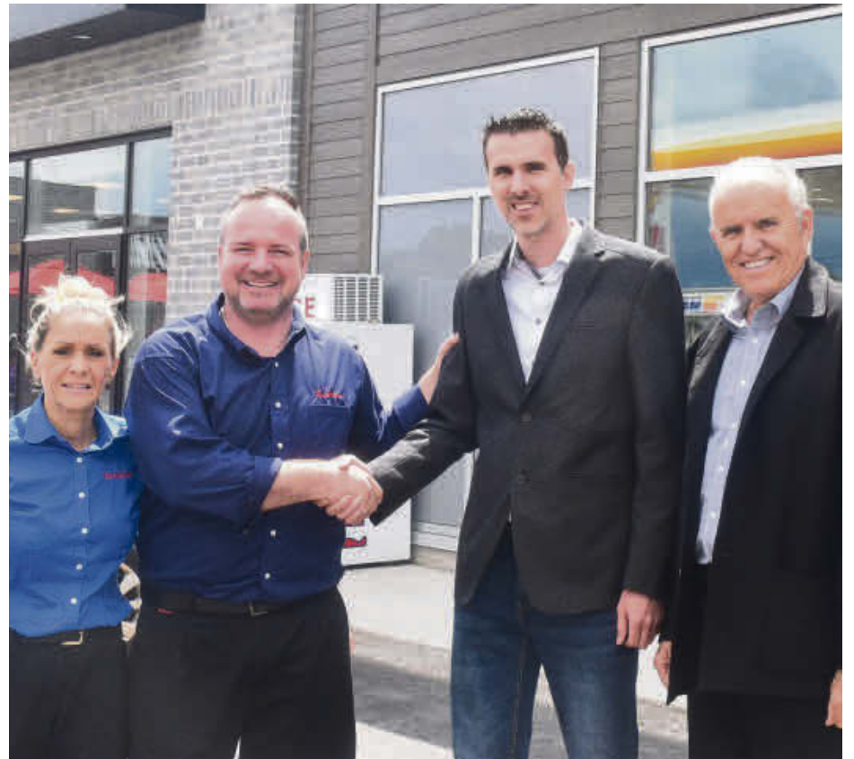
Le Tim Hortons et la station-service Shell ont ouvert conjointement leurs portes la semaine dernière, sur l'ancien terrain du Motel Unic.

de bâtiments industriels et commerciaux, de même que la firme Caroline Bousquet Architecte ont également été mises à contribution.