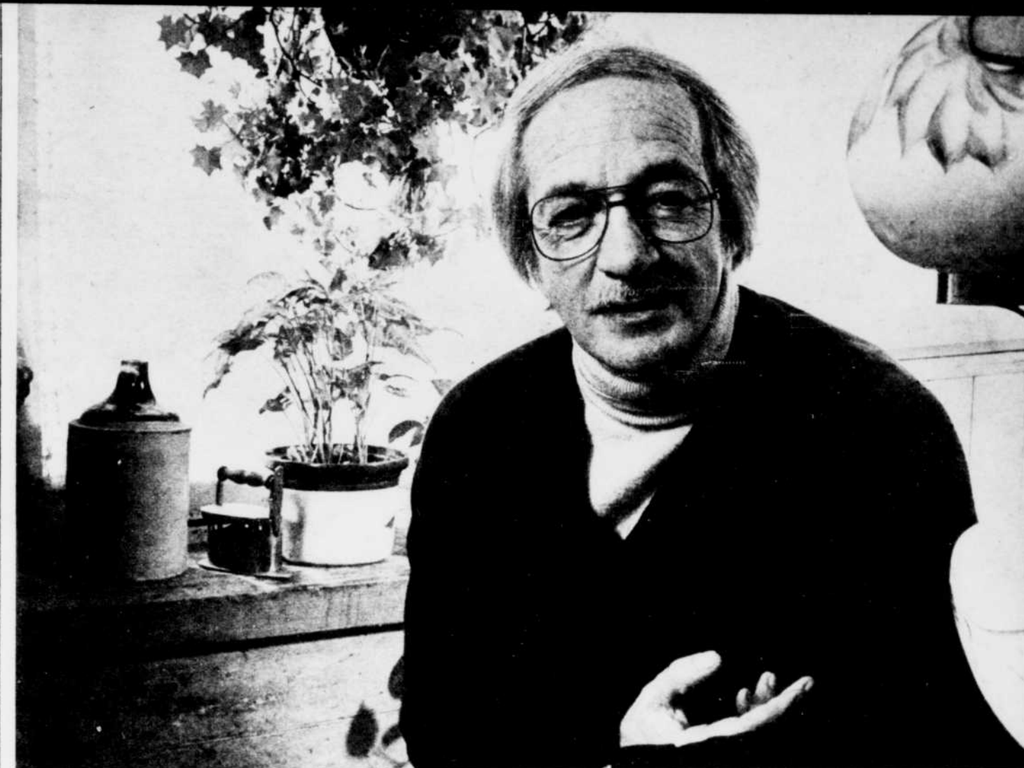
Les régimes d'épargne-retraite du Trust Général.