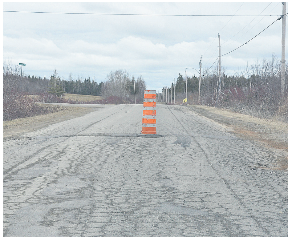
Voici une partie de la Route Marcil qui est très affectée par la fonte de la neige.

Pour l'histoire, mentionnons que cette route a été nommée en l'honneur ou en souvenir de Charles Marcil (1er juillet 1860 – 29 janvier 1937), homme politique fédéral du Québec et député du comté de Bonaventure à la Chambre