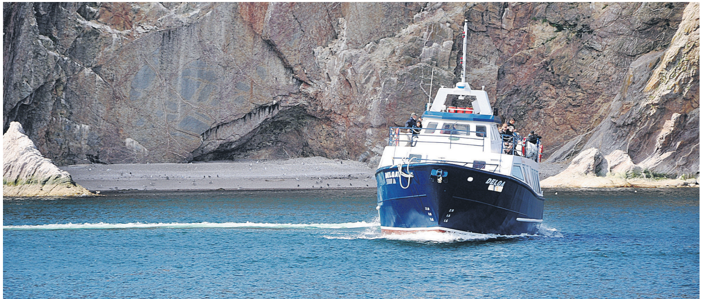
Le Géoparc offrira des excursions en mer cette année. Les circuits permettront de découvrir de nouveaux géosites, jusqu'à ce jour inexplorés à Percé.

La solidarité entre tous les intervenants et organismes de Percé a véritablement été à la base