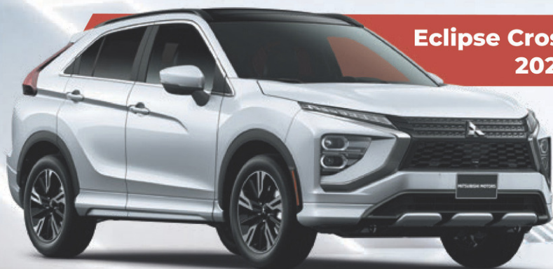
Eclipse Cross 2024