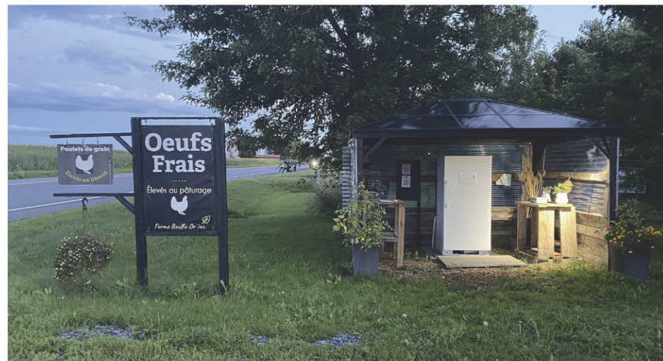
La ferme Bouffe-Or remplace le réfrigérateur par une boîte en bois isolé pendant l'hiver pour protéger les oeufs du froid.

«On a fait un premier projet avec une boutique plus proche de la maison. Ensuite, on a déplacé le kiosque près de la route et on voit que les gens sont vraiment honnêtes. On a eu des commentaires positifs. Les gens sont très reconnaissants de ce geste de bonne foi. Ils sont fiers qu'on leur fasse confiance», conclut Mme Gauvin Gauthier.