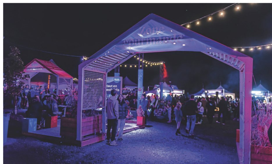
La Zone gourmande accueillait les visiteurs près de la Place publique.