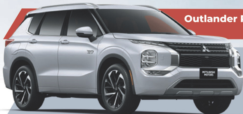
Outlander PHEV 2024