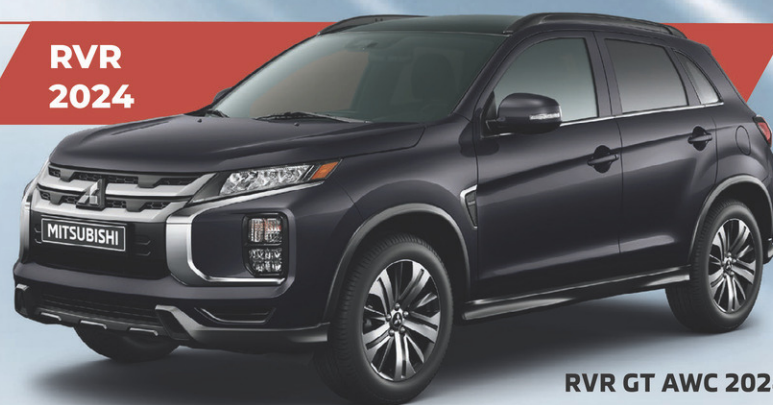
RVR GT AWC 2024