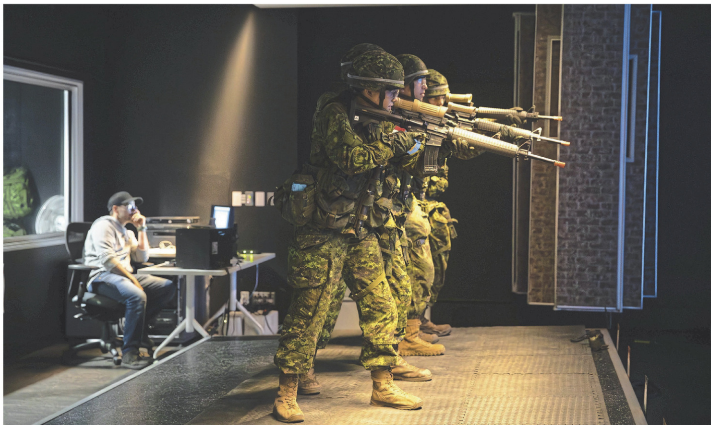
Après leur immersion dans le monde militaire, les recrues d'un jour auront un bon aperçu de ce qui les attend dans les Forces canadiennes.