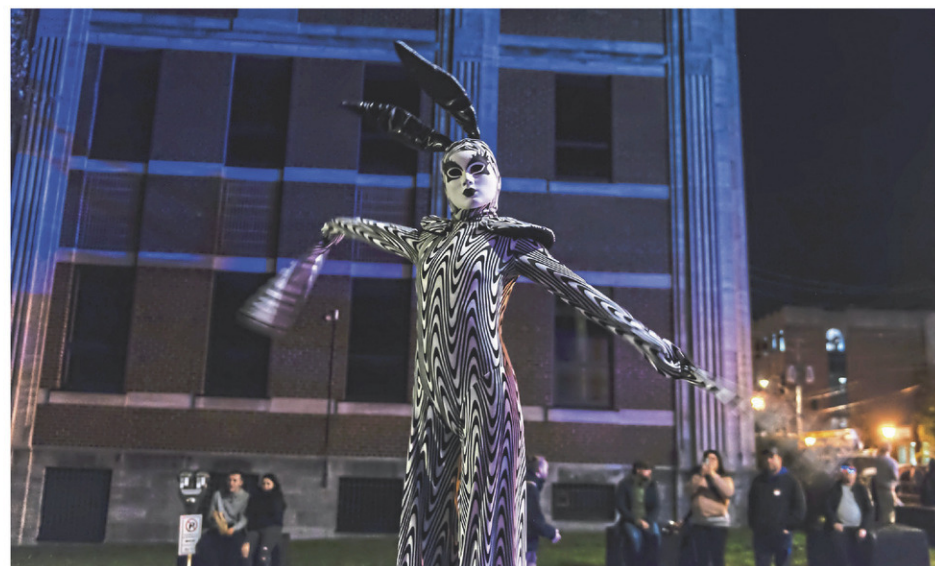
Cette artiste sur des échasses a elle aussi respecté le thème de la soirée avec son costume faisant référence au personnage de Beetlejuice.