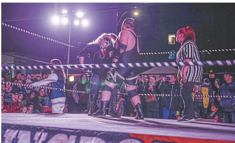
Les lutteurs de la Fédération québécoise de lutte étaient de retour dans le ring de Mon Vieux Saint-Jean la nuit.