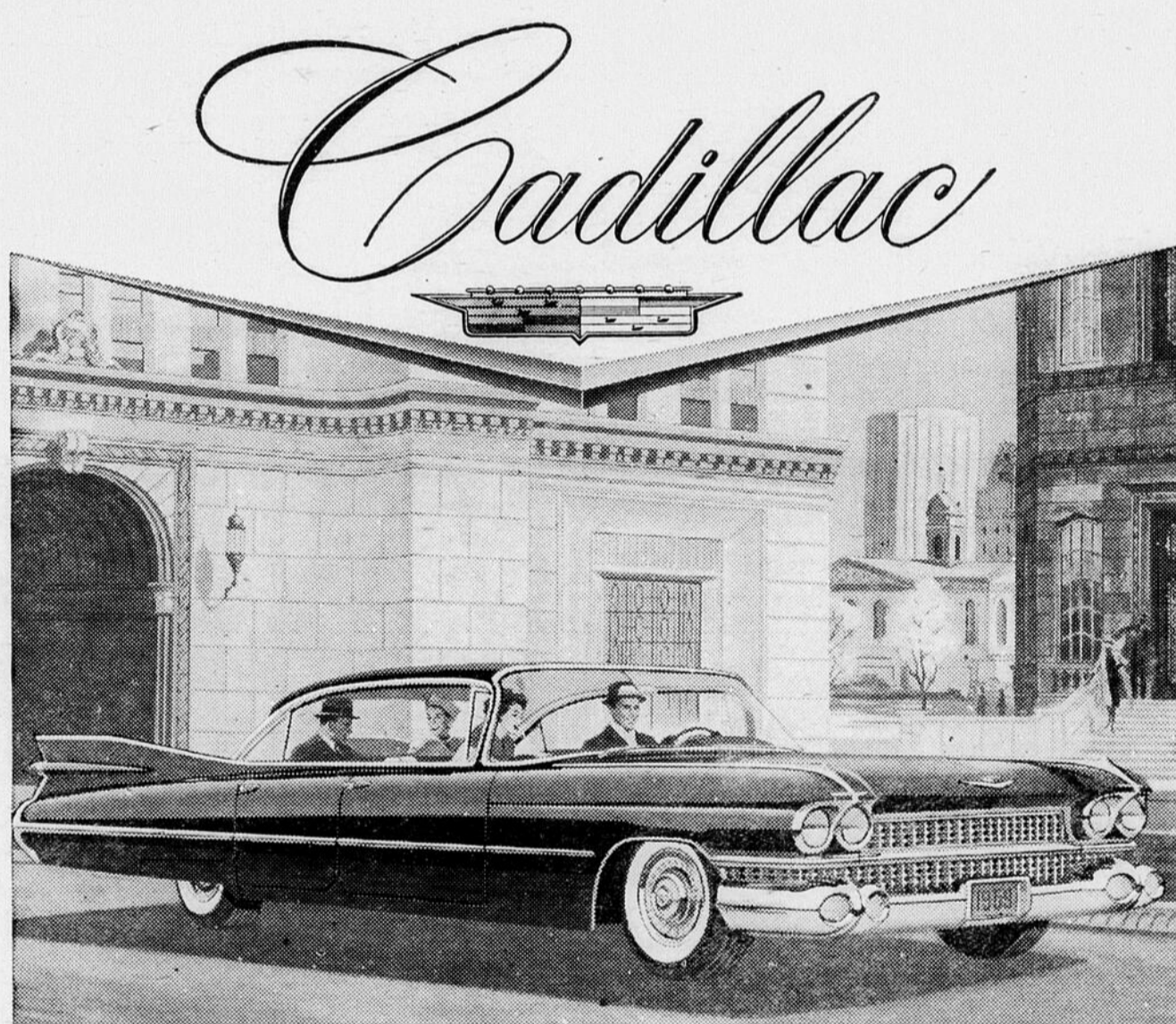
UNE VALEUR GENERAL MOTORS

Pour une année complète, un contribuable marié qui a deux enfants et un revenu de $3,000 versera $56 en impôt — $4 de plus, tandis que s'il a un revenu de $5,000 son impôt atteindra $390 et sur un revenu de $10,000 son impôt sera de $1504.