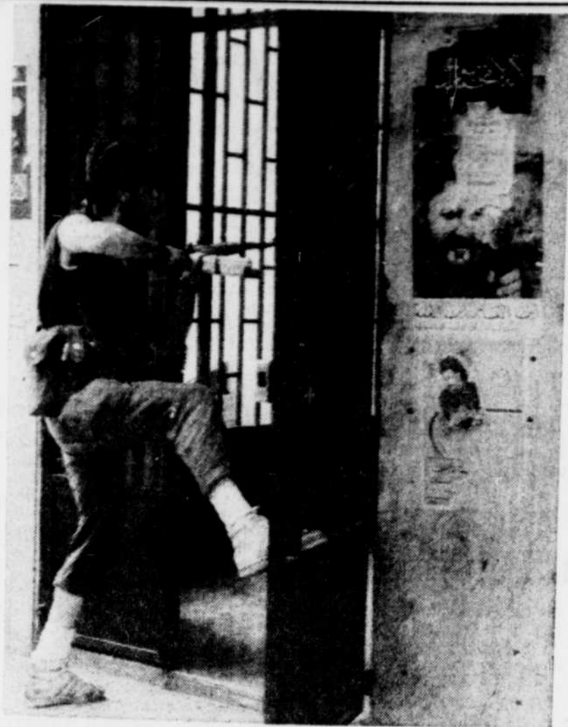
Un milicien druze pénètre dans un édifice qui servait de permanence aux hommes d'Amal dans le quartier commercial de Zarif et qui leur a été enlevé hier après d'âpres combats.

Cette source a indiqué que la première prise de bec téléphonique avait eu lieu en décembre et la deuxième, il y a 10 jours environ. ●