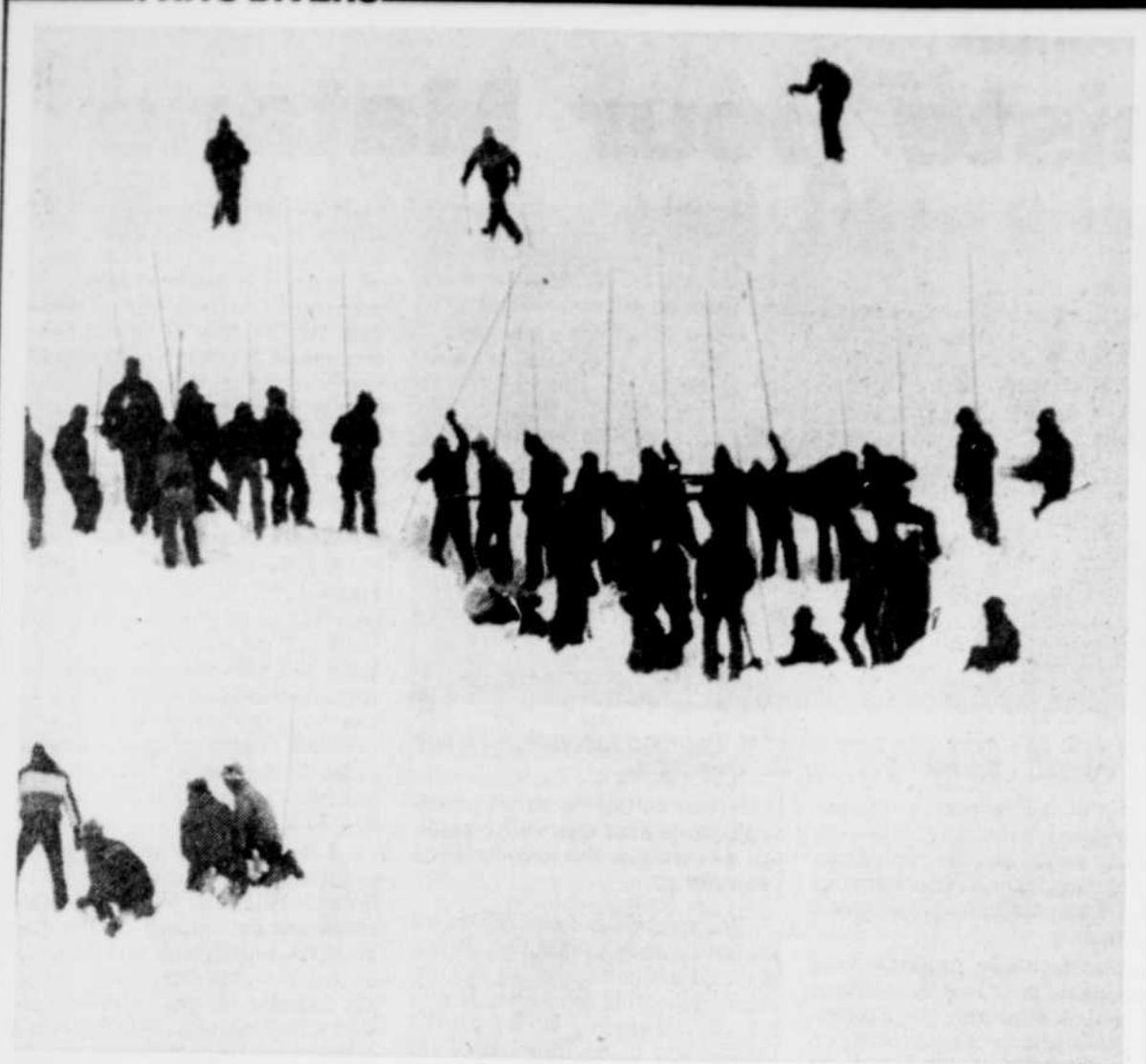
Skieurs tués par une avalanche Trois skieurs qui pratiquaient leur sport, mercredi, en dehors des limites de la station de ski de Breckenridge, au Colorado, ont perdu la vie par suite d'une avalanche. L'un des corps a été retrouvé en fin de journée mercredi, et les deux autres hier. Environ 250 volontaires participent toujours aux recherches en vue de retracer un quatrième skieur porte disparu.