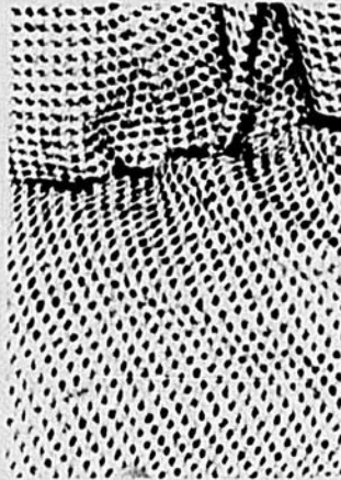
Philosopher au Québec a toujours été le contraire d'une délivrance (Jacques Brault).

Dans un article qu'il publiait récemment dans la revue "Parti Pris", le prof. Jacques BRAULT exhortait nos philosophes à être présents ici et maintenant afin qu'ils cessent une fois pour toutes de vivre en marge de notre monde. Mais, prenait-il la peine d'affirmer, en guise d'excuse, "philosopher au Québec a toujours été le contraire d'une délivrance, car la vérité préexistait si purement et si extérieurement à la conscience que nulle initiative de la liberté n'était possible, et par là, (il faut en-