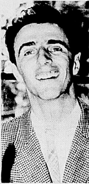
Vigneault: ... il transcende son folklore!

La portée folklorique d'une expression ne tend pas, comme on pourrait le penser d'abord, dans la reconstitution des habitudes de vie que l'on retrouve dans une oeuvre, mais bien dans la mentalité régionale de celui qui a voulu dire quelque chose.