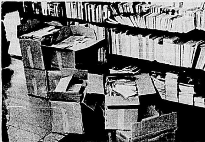
“Une documentation mitée et incomplète.”

Nous reconnaissons certaines fissures, certains vides au plan de l'orientation de la recherche et de l'activité communautaire. Nous tentons présentement d'élaborer certains programmes de recherche, déterminés en fonction des différents secteurs de la connaissance philosophique. Une telle planification est nécessaire si nous voulons réaliser nos chances de développement. Notons qu'au niveau collégial la situation est encore plus ambiguë et plus difficile. Le manque de spécialisation y est latent. Ayant