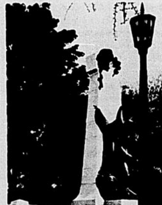
Héros sublimes mais sans signification pour le présent.

Ces héros correspondaient bien à l'image idéale que la bourgeoisie se faisait d'elle-même et de l'homme québécois