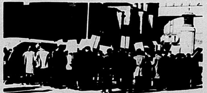
La réflexion philosophique ne trouve pas son point de départ dans les livres...

Or, qu'est-ce que cette attitude sinon inverser tout à fait la démarche philosophique elle-même? Qu'est-ce sinon oublier tout à fait la condition de l'humain, qu'est-ce sinon se donner bonne conscience et ne pas tenir compte de ce qui est en face de nous, autour de nous et en nous, quand on se regarde tel qu'on est?