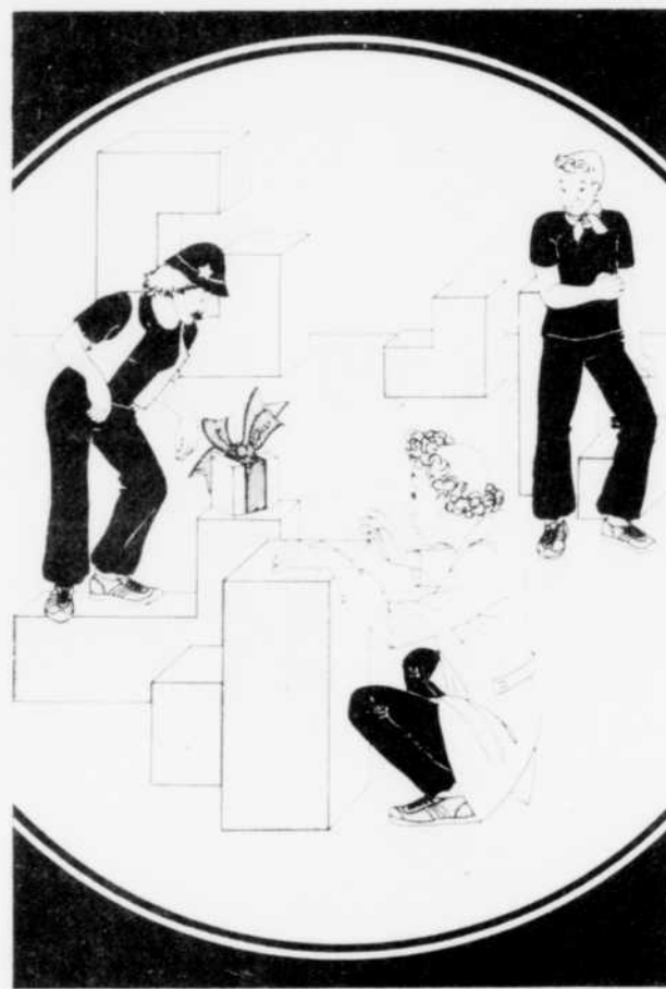
Pile ou Face, prends ta place , une création du Théâtre du Sang Neuf.