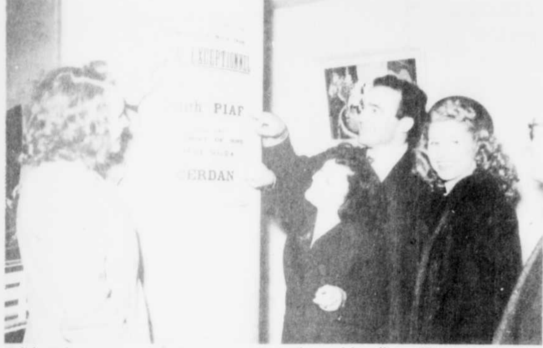
Edith Piaf (au centre) et le boxeur Marcel Cerdan, qui fut, dit-on, l'homme qui marqua le plus sa vie.

reux et solitaire, le légionnaire tendre et bagarreur, le motard redoutable... Sa vision du monde est en fait celle de la petite fille aveugle et abandonnée, gardant au fond d'elle-même un féroce appétit de vivre... dangereusement. Monstre sacré à la ville comme à la scène, Piaf entretient sa légende à grand renfort de publicité et de scandales. Vivant dans un luxe bohème, avec femmes de chambre et