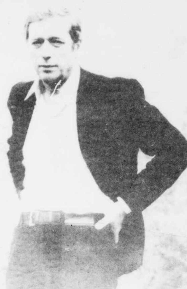
Yves Montand grande vedette du music-hall et l'un des premiers acteurs français.

suivi par "Z", "L'Aveu", "État de siège", "Vivre pour vivre", en 1967, réalisé par Claude Lelouch et quelques autres... qui marquent comme les cailloux d'un grand Poucet, le chemin suivi à travers les contradictions d'une vie confondue avec les paradoxes d'une carrière: superproduction avec "La folie des grandeurs", de Gérard Oury, films tendres avec Claude Sautet "César et Rosalie", "Vincent, François, Paul, et les autres", film expérimental avec "Tout va bien", de Godard, films politiques avec Costa Gavras, comédie avec "Le sauvagement", de Rapeneau, policier avec "Police Python", d'Alain Corneau, avant d'enchaîner avec "La menace".