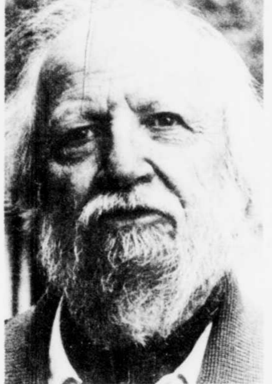
L'écrivain britannique William Golding

ses de son roman Rites de passage , édité en 1980 en Grande-Bretagne et ce mois-ci en France, lui a valu le Booker Prize, le Goncourt anglais. Il a écrit