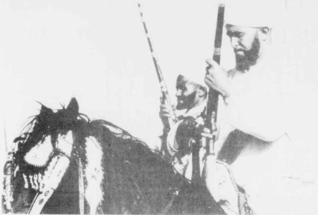
Une scène du film "Les peuples cavaliers".

Le projet auquel travaille actuellement Jérôme Delcourt, qui avait précédemment offert un film sur le Bali, portera sur le nord ouest canadien où il tentera de retrouver l'histoire de la ruée vers l'or du Yukon et de montrer aussi la vie dans les montagnes Rocheuses.