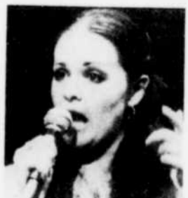
FABIENNE THIBEAULT, à l'Université de Sherbrooke le 9 novembre à 20h30

9 MERCREDI FABIENNE THIBEAULT un spectacle intitulé "Coeur Voyageur" avec Fabienne Thibault. Lorsqu'on est chanteuse et qu'il existe une cohérence entre ce que l'on fait et ce que l'on dit, il se doit d'en exister une entre ce que l'on vit et ce que l'on chante. "Salle Maurice O'Bready, Université de Sherbrooke le 9 novembre à 20h30 (819) 565-5430