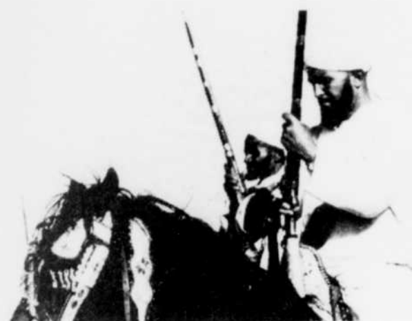
Les peuples cavaliers de la Mongolie à l'Arizona.