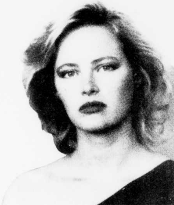
Gabrielle Lazure dans Sarah, un film de Maurice Dugowson.

Un film américain (1982), de Sidney Lumet, avec Paul Newman, Charlotte Rampling et James Mason. Représentations: 19h30 et 21h30.