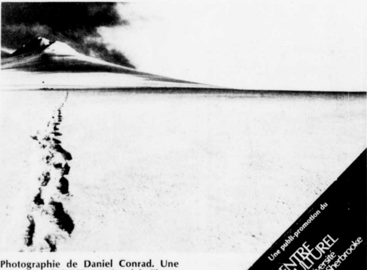
Photographie de Daniel Conrad. Une exposition de l'Office national du film.

Grande Première. Un spectacle-animation à tableaux multiples et colorés; l'entrée au travail d'un nouveau professeur; le cadeau surprise des élèves à leur prof.; une répétition de théâtre inattendue; etc., etc. Ce spectacle met en lumière, avec humour, les difficultés de relations entre élèves et professeurs. Pile ou face, prends ta place favorise l'amélioration du climat de vie à l'école. Billets en vente actuellement.