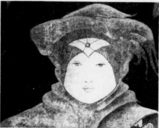
L'IMPÉRATRICE et VENDREDI SOIR, la Galerie d'art l'Œil approvoisé à Granby, 1 er au 30 novembre.