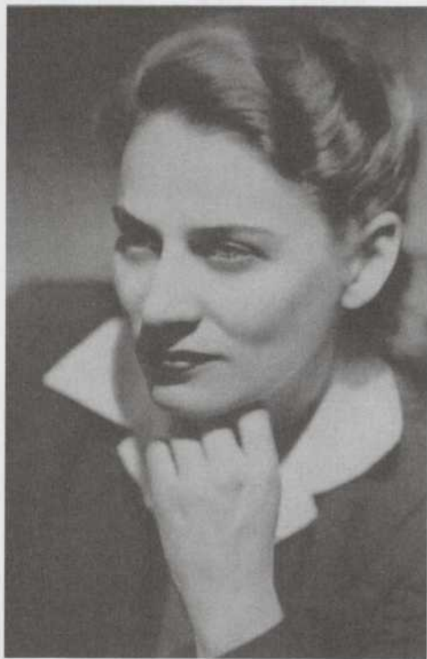
Gabrielle Roy en 1945.

Quand elle entreprend l'écriture de son autobiographie, à la fin des années soixante-dix, Gabrielle Roy est déjà une vieille femme. À plus de soixante-dix ans, avec derrière elle une œuvre colossale auréolée de prix, elle voit défiler à rebours sa jeunesse perdue.