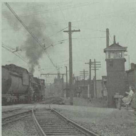
La locomotive et le wagon de queue passent sur la voie ferrée devant Gabrielle Roy dans le quartier Saint-Henri « ébranlé par le passage des trains ».

quartier, l'un des plus pauvres de Montréal. En pressentant, dit-elle, « qu'il me devenait le décor et un peu la matière d'un roman ». L'âme en peine, elle rentre dans la chambre vétuste qu'elle occupe sur la rue Stanley. Ce soir d'avril 1939 s'annonce pourtant comme le soir du commencement.