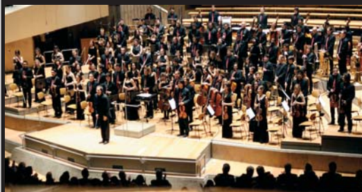
L'ORCHESTRE MONDIAL DES JEUNESSES MUSICALES À LA PHILHARMONIE DE BERLIN

Les 7 trompettes de Fred Piston est un spectacle interactif qui, de la préhistoire jusqu'à demain, musicalise avec joie et virtuosité le plus royal des instruments. Un concert animation qui pistonne, rien de moins !