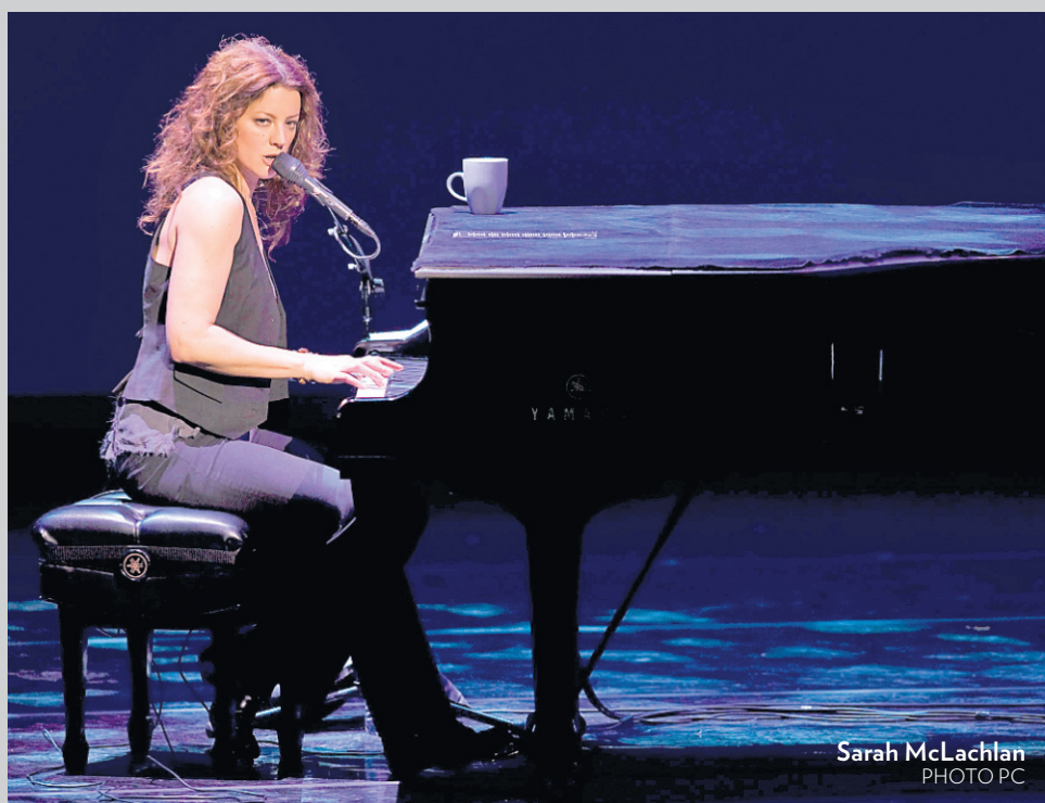
Sarah McLachlan