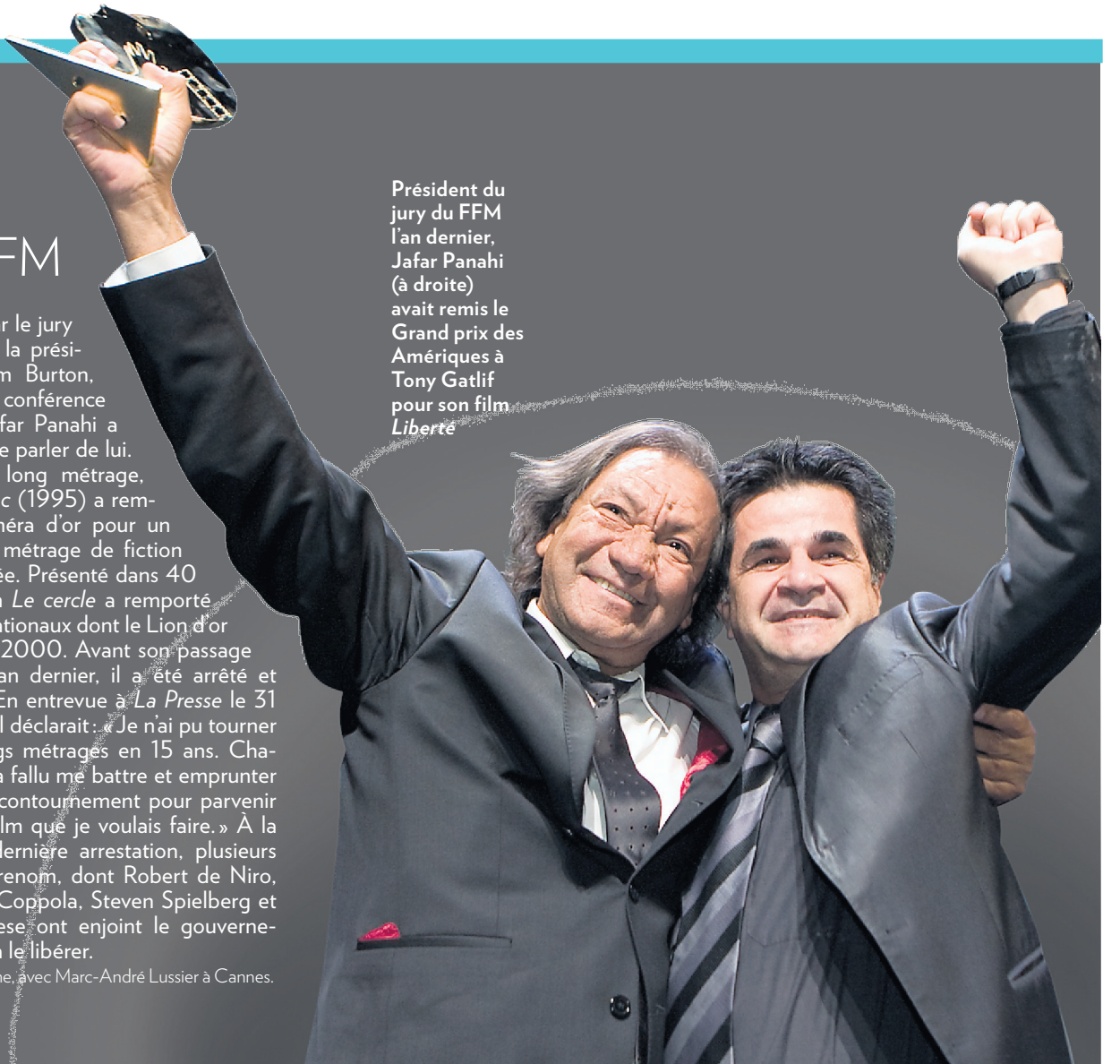
Président du jury du FFM l'an dernier, Jafar Panahi (à droite) avait remis le Grand prix des Amériques à Tony Gatlif pour son film Liberté .