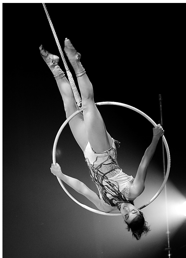
Extrait du spectacle des finissants de l'École nationale de cirque.

Ce dernier s'enthousiasme à l'idée que chaque spectacle explorera à fond l'un ou l'autre des arts du cirque. Ce sera le cas par exemple avec les Colporteurs où les gens