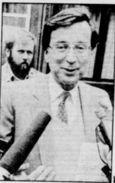
Le premier ministre Bourassa a accueilli la nouvelle avec joie, mais sans surprise.