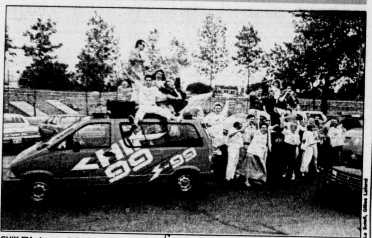
CHIK-FM n'a pas atteint le premier rang, bien entendu, mais la station progresse constamment. En un an, elle est passée de 126,000 à 194,000 auditeurs. De quoi réjouir les membres de l'équipe.