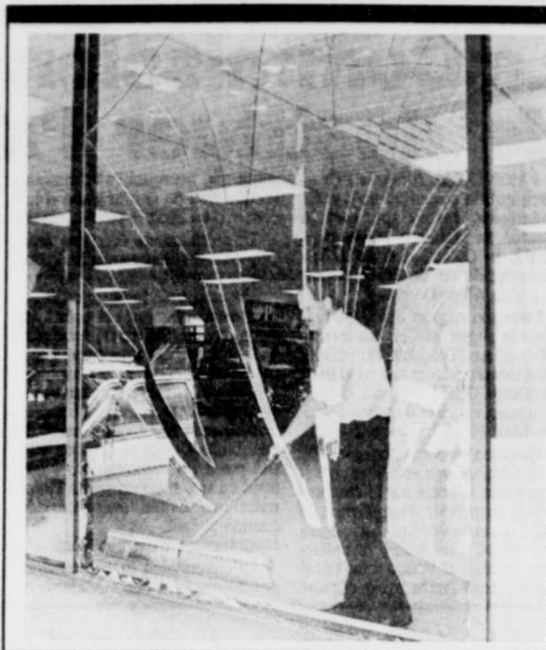
Le Soleil, Roland Marcoux

Accrochés aux murs de la petite classe, trônent les tableaux des détenus inscrits aux cours d'arts plastiques. Qu'ils illustrent un paysage, un animal ou un personnage féminin, tous lancent cependant le même cri, celui de la soif de liberté... ●