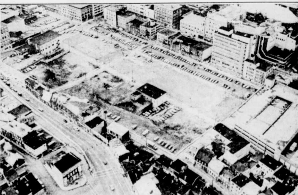
Le Soleil, Clément Thibault

Dans un protocole d'entente signée avec la ville de Québec en septembre 1986, la firme Citicom s'engageait à soumettre un projet d'au moins $150 millions, devant comprendre un ou plusieurs magasins à grande surface, des commerces, des