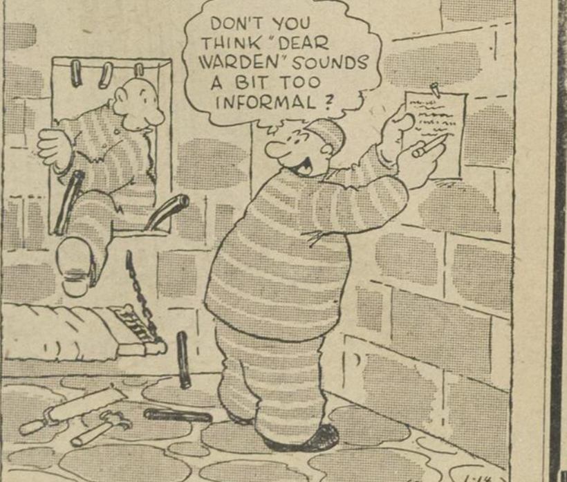
"Ne penses-tu pas que 'cher gardien' n'est pas assez poli encore...?"