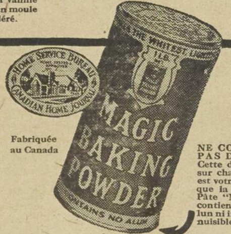
Le nouveau Livre de Cuisine "Magic" traite pour vous être d'une grande utilité avec ses douzaines de délicieuses recettes. Demandez-le à Gillett Products, Fraser Avenue, Toronto 2.

1/4 tasse beurre 1/4 tasse farine à pâtisserie ou 1 tasse farine à pain 1/4 tasse sucre granulé fin 2 c. à thé Poudre à Pâte "Magic" 1/4 tasse eau bouillante 2 carrés chocolat non sucré 2 jaunes d'œufs-1 blanc d'œuf 1/2 tasse lait Tamisez 3 fois ensemble farine, Poudre à Pâte "Magic" et sel. Battez les jaunes d'œufs et le blanc (gardant 1 blanc pour le glaçage). Mettez le beurre dans un bol à mélanger, ajoutez le sucre. Versez l'eau bouillante sur le chocolat tranché mince, brassez vivement et, lorsque fondu, ajoutez au mélange de beurre. Ajoutez les œufs battus, puis les ingrédients secs, alternant avec le lait; ajoutez la vanille et battez tout ensemble. Versez dans un moule à gâteau graissé et cuisez à four modéré. GLAÇAGE: Faites bouillir ensemble 1 tasse sucre et 1/2 tasse eau bouillante sans brasser, jusqu'à ce que le sirop fasse des fils au bout de la cuillère. Battez 1 blanc d'œuf ferme et versez graduellement dessus le sirop, battant constamment jusqu'à consistance assez épaisse pour garnir le gâteau. Ajoutez 1 c. à thé vanille (ou 1/2 c. à soupe jus de citron) puis étendez sur le gâteau. Parsemez le dessus de 1/2 tasse d'amandes blanchies ou de noix de Grenoble brisées. Si des guimauves sont employées, incorporez-les dans le sirop chaud, juste avant de verser sur l'œuf battu. Battez mousses et garnissez le gâteau. Parsemez le dessus de guimauves.