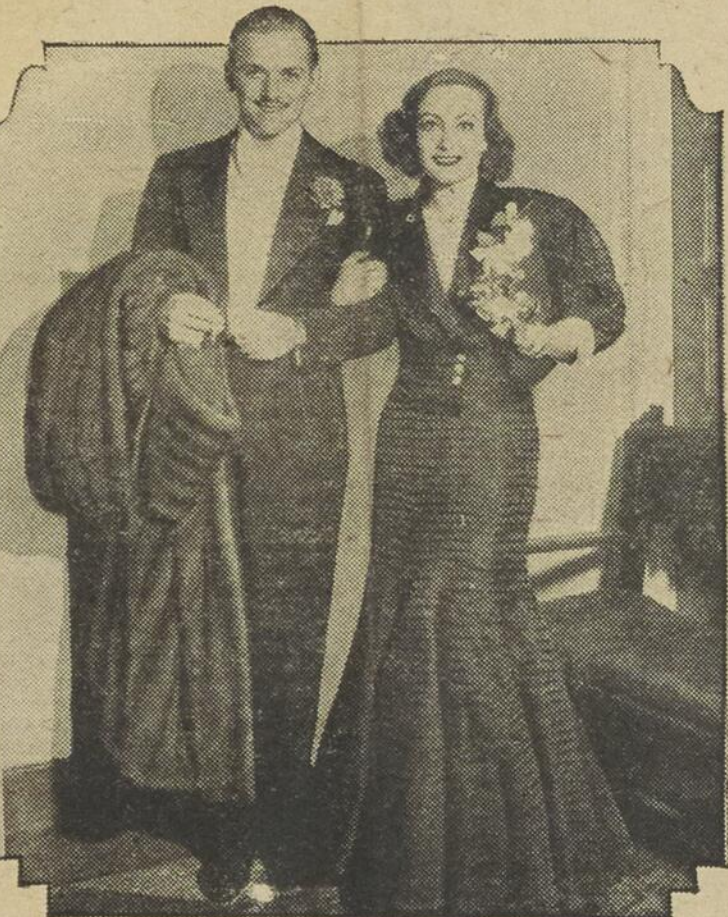
Deux des grandes étoiles du monde du cinéma, Douglas Fairbanks Jr. et son épouse Joan Crawford, sont photographiés à leur arrivée au Théâtre de Hollywood pour la première représentation d'une grande vue.