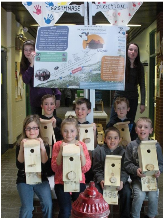
Des élèves de l'école de la Rose-des-Vents présentent leurs niochors.

professeurs de l'Université du Québec à Rimouski, effectueront le suivi chronologique de la période de reproduction de différentes espèces d'oiseaux migrateurs de la région immédiate de Rimouski. L'objectif du projet est de mieux connaître la capacité des oiseaux à s'adapter aux changements climatiques, dans une optique de sensibilisation des enfants aux conséquences de ces perturbations de l'environnement sur la biodiversité.