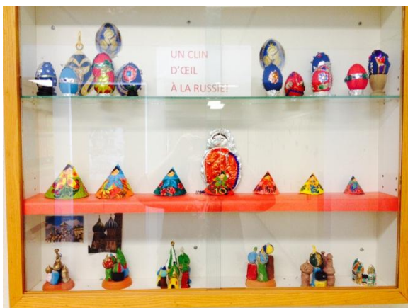
Les élèves du service de garde La Bricole présentent leurs poupées russes.

Lors du concert, les œuvres picturales d'inspiration russe réalisées par les élèves de l'école ont été projetées sur un écran pour accompagner la musique du compositeur Moussorski intitulée « Les tableaux d'une exposition ». Les élèves du service de garde La Bricole participent également à l'événement en exposant leurs poupées russes dans le hall de la salle de spectacle à partir de 18 heures le soir même.