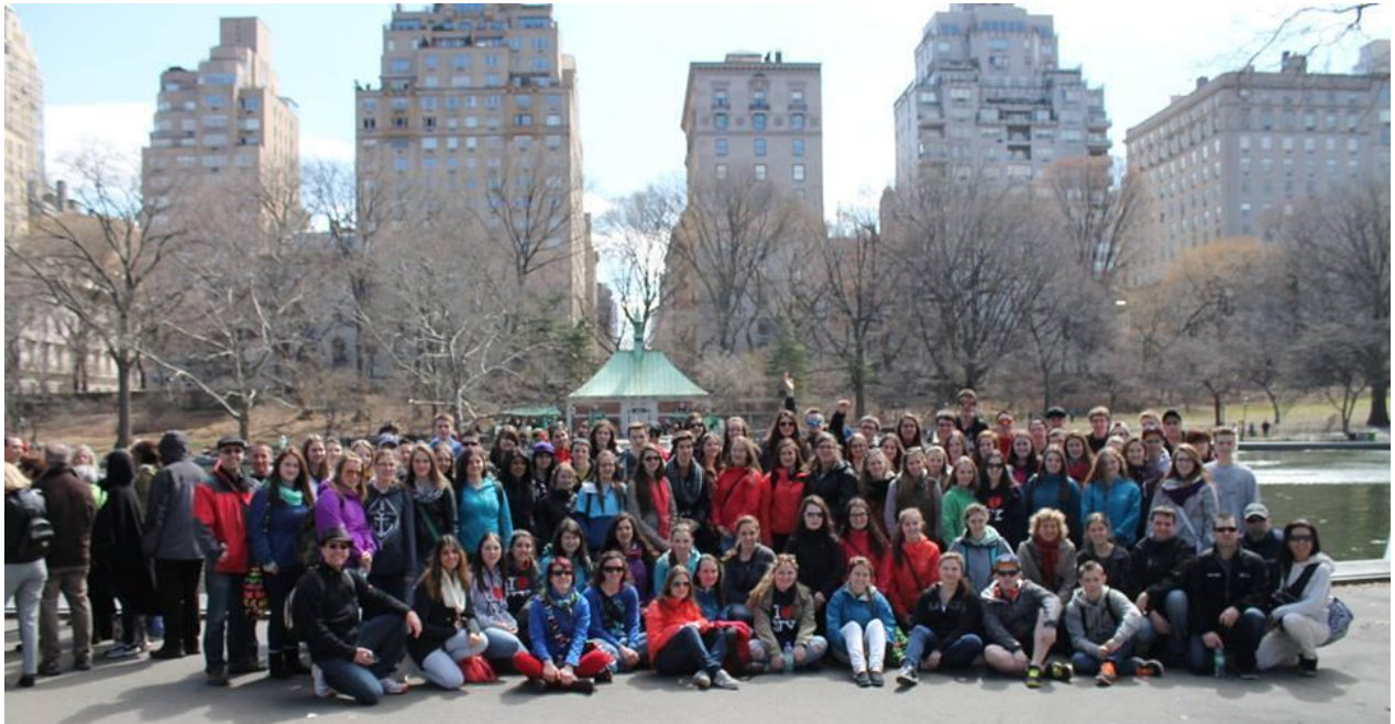
Les élèves des ensembles de guitares et de l'harmonie du Mistral à New York au début d'avril.