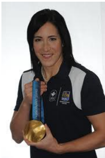
Caroline Ouellette présente fièrement son avant-dernière médaille d'or olympique, celle remportée à Vancouver en 2010.

La hockeyeuse Caroline Ouellette a visité l'école Langevin le 17 avril dernier. Médaillée d'or en hockey féminin aux Jeux de Sotchi, Caroline Ouellette a entretenu les élèves de première et de deuxième secondaire de ses expériences olympiques et de l'importance de la persévérance.