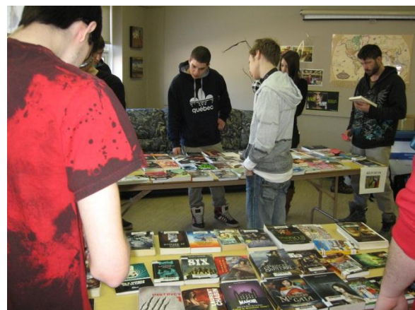
Des participants lors d'un mini salon du livre organisé dans le cadre du "Pool" de lecture au CFA de Mont-Joli-Mitis.

Le « Pool » de lecture est un concours à caractère ludique et pédagogique. Les élèves doivent lire pour accumuler des points et ainsi avoir la chance de gagner des prix. Dans le cadre de ce projet, une période de 30 minutes de lecture a été ajoutée à l'horaire quotidien des élèves et diverses activités sont organisées régulièrement.