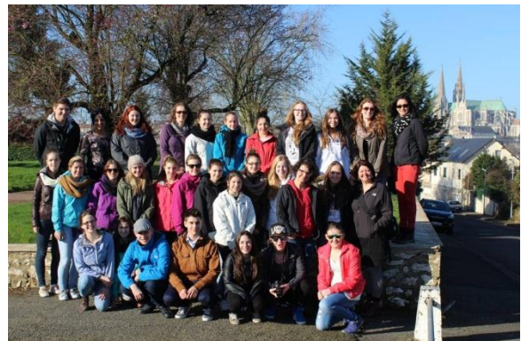
Le groupe d'élèves de l'école Paul-Hubert en France. En arrière-plan, la cathédrale de Chartres.

Le comité de voyages culturels de l'école Paul-Hubert a permis cette année de faire vivre une expérience enrichissante et inoubliable à 26 élèves de troisième, quatrième et cinquième secondaire durant la relâche scolaire. Ils ont passé neuf jours à sillonner la France pour visiter des sites historiques et patrimoniaux en compagnie d'un guide de la compagnie Voyages culturels EF, spécialisée en voyages étudiants.