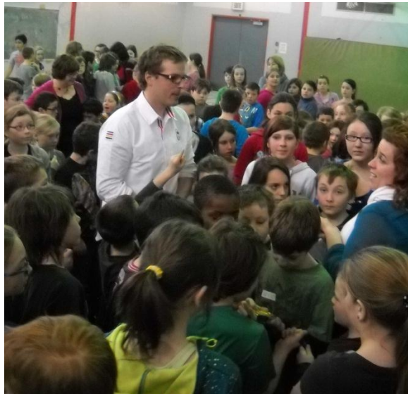
L'athlète paralympique Philippe Gagnon est entouré d'élèves de l'école Norjoli lors de sa conférence en mars dernier.

marquants de sa carrière sportive, de même que tous les obstacles auxquels il a dû faire face dès sa naissance avec un léger handicap, les pieds bots.