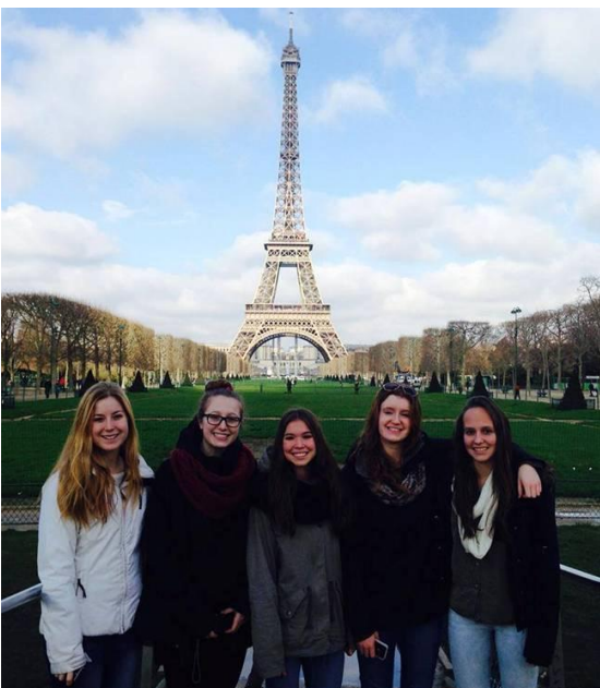
Des élèves de l'école Paul-Hubert devant la tour Eiffel à Paris.

et la Normandie. Les élèves ont pu notamment visiter la ville de Paris lors d'une croisière sur la Seine en bateau-mouche, plusieurs châteaux de la Loire, le Mont Saint-Michel, le Louvre, de nombreux lieux saints, le mémorial de Caen (musée de la Seconde Guerre mondiale) et la plage de Juno (où des centaines de Canadiens ont perdu la vie lors du débarquement de Normandie).