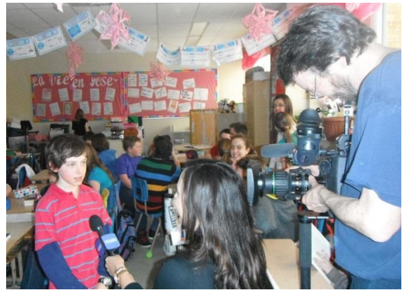
Une expérience de tournage professionnel enrichissante pour des élèves de l'école de l'Estran.