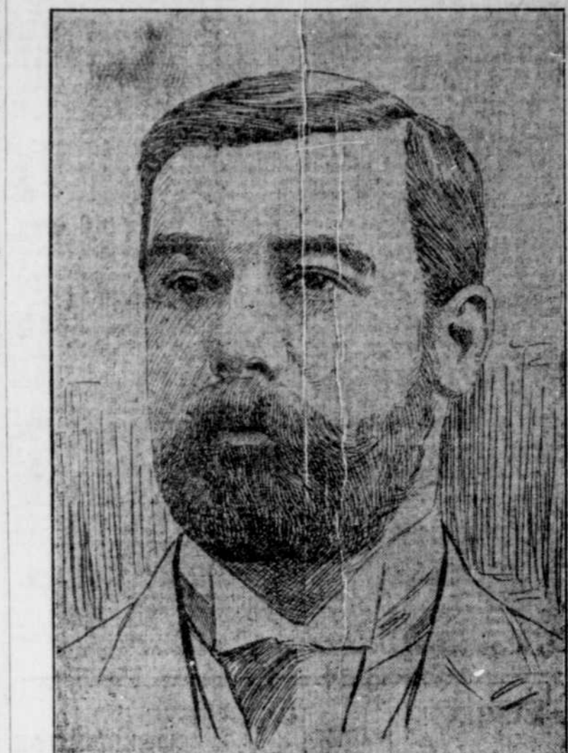
L'HON. M. JAMES SUTHERLAND—Le nouveau ministre des Travaux Publics.