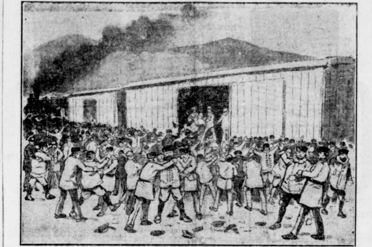
LES DOUKHOBORS AUX PRISES AVEC LES AUTORITES DU MANITOBA.—Scènes reconstituées d'après les dépêches qui nous sont parvenues.

Mais les constables du gouvernement les font obéir de force et sont même obligés de se servir de bâtons.—Un citoyen se fait presque arracher une oreille.—On appréhende des troubles plus graves.