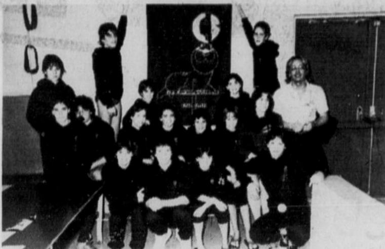
Les membres du Club de natation de Valleyfield ont participé en fin de semaine dernière à la compétition provinciale de natation qui avait lieu à la Cité des arts et des sports.