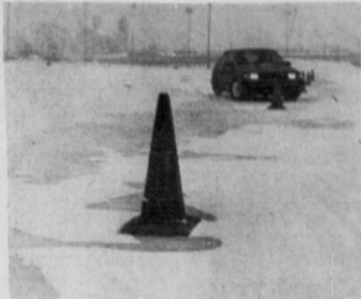
La tempête de samedi dernier constituait un cadre parfait pour des cours de conduite préventive sur glace.