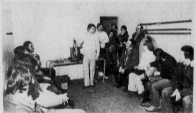
Les automobilistes qui ont assisté au cours de conduite préventive sur la glace donné par la compagnie Bell Canada ont apprécié leur expérience.

leyfield qui parcourt plus de 2 millions de kilomètres annuellement. Dans le cadre du cours, M. Tessier enseigne à ses élèves que lorsque la voiture dérape, il faut surtout éviter d'enfoncer les freins. Dans un premier temps, il faut, tout en tenant fermement le volant, lever le pied de l'accélérateur et braquer les roues avant dans la direction que vous voulez lui faire prendre. Dès que vous sentirez le volant à nouveau droit, redressez les roues et soyez prêts à faire face à un nouveau dérapage en sens inverse. Commencez alors à freiner doucement, vous sentirez la voiture ralentir. Si elle cesse de ralentir... vous recommencerez à déra-