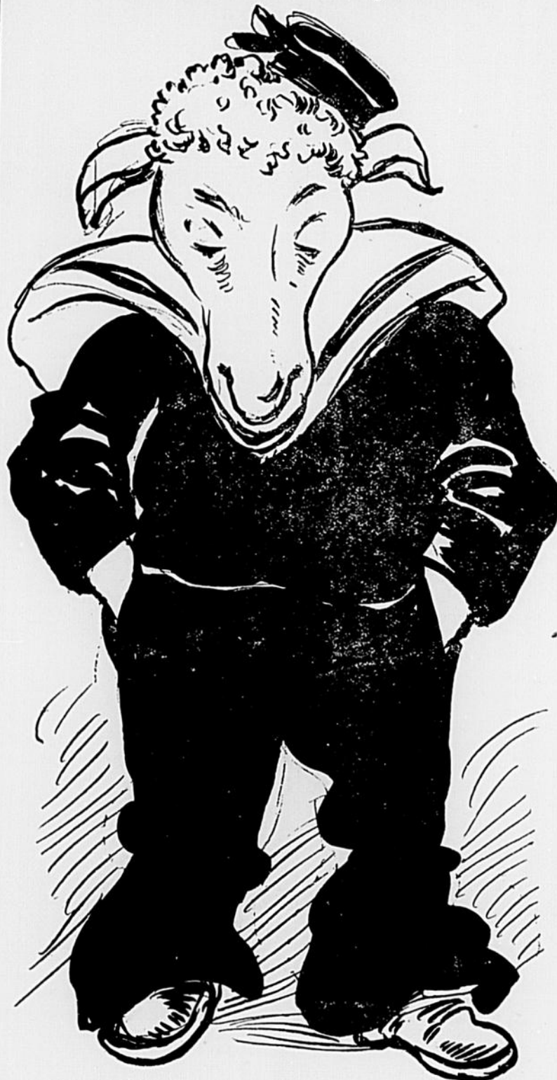
LE MOUTON DE BAPTISTE. — Si ma défunte mère me voyait !

maintenant la campagne anti-alcoolique. On devrait au moins attendre que les élections municipales soient passées, parce que la boisson, en temps d'élection, vous savez, ça n'est pas à dédaigner.