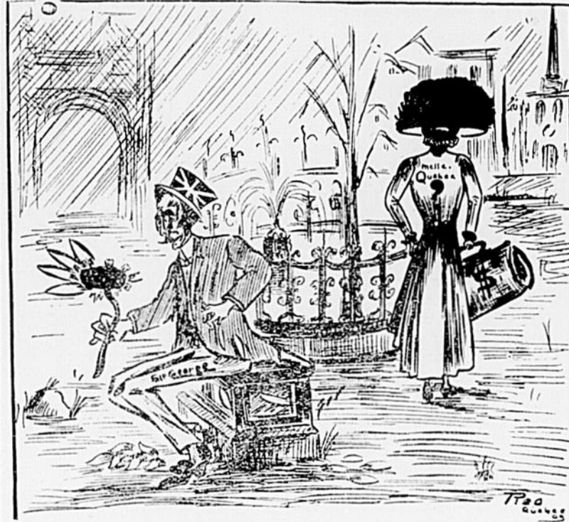
Sir George : Elle m'aime, un peu, beaucoup, tendrement ; pas du tout.

mes confrères qui ont des blondes de ne pas les embêter trop pendant deux jours, car les québécois sont très friands, dit-on des minois montréalais.