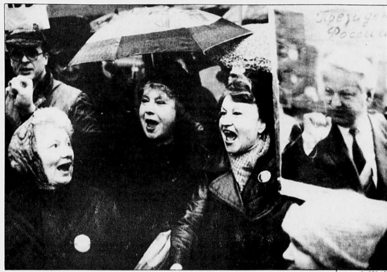
Les partisans de Boris Eltsine manifestent à Moscou