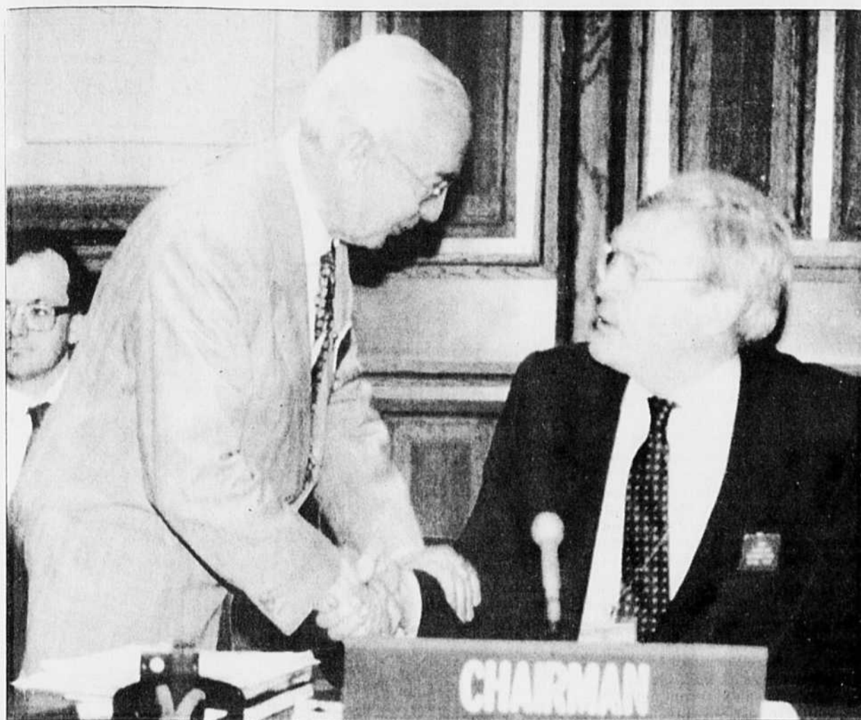
Le ministre du Commerce international Michael Wilson, également président du Comité intérimaire du Fonds monétaire international (FMI), est accueilli à Washington par le directeur du FMI Michel Camdessus.

Le Canada prend ses distances vis-à-vis les États-Unis qui veulent stimuler l'économie mondiale