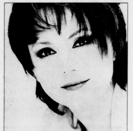
ARCHIVES LE SOLEIL Johanne Blouin

On n'aura bientôt plus besoin de carte et encore moins d'une clé pour entrer au bureau: un lecteur d'empreintes du visage se chargera de vous ouvrir la porte seulement à voir votre binette. Aussi, un reportage sur le Champion Chip, une puce électronique accrochée aux chaussures des coureurs, qui permet de déterminer plus précisément leur arrivée au fil d'arrivée. La conquête du futur , Z à 20 h.