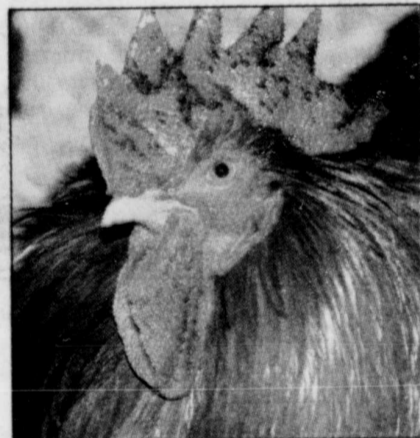
Pour les jeunes qui tomberaient amoureux de la ferme, on y tient aussi un camp de vacances baptisé « L'Arche de Noé ».