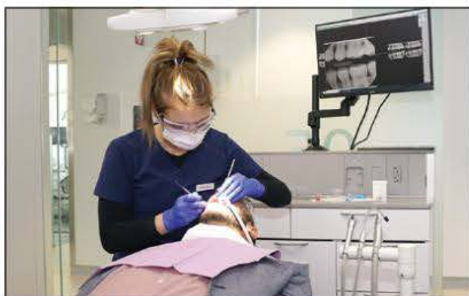
Un investissement de 13 M$ ont permis d'actualiser la clinique, les locaux de classe et les laboratoires, en plus d'acquérir de l'équipement à la fine pointe de la technologie.

Le programme de Techniques d'hygiène dentaire du Cégep Garneau permet de diplômer environ 42 personnes selon les années. Le taux de placement est aussi élevé que 100 %. Les étudiants ont l'occasion de parfaire leurs pratiques en offrant à la population de la région de Québec des traitements de haute qualité supervisés par une équipe enseignante. Une clientèle fidèle de plus de 3000 personnes reçoit des soins bucco-dentaires réguliers dans la Clinique-école. ■