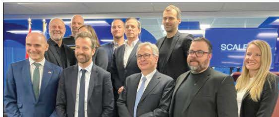
Les participants à cette très importante conférence de presse tenue tout récemment.