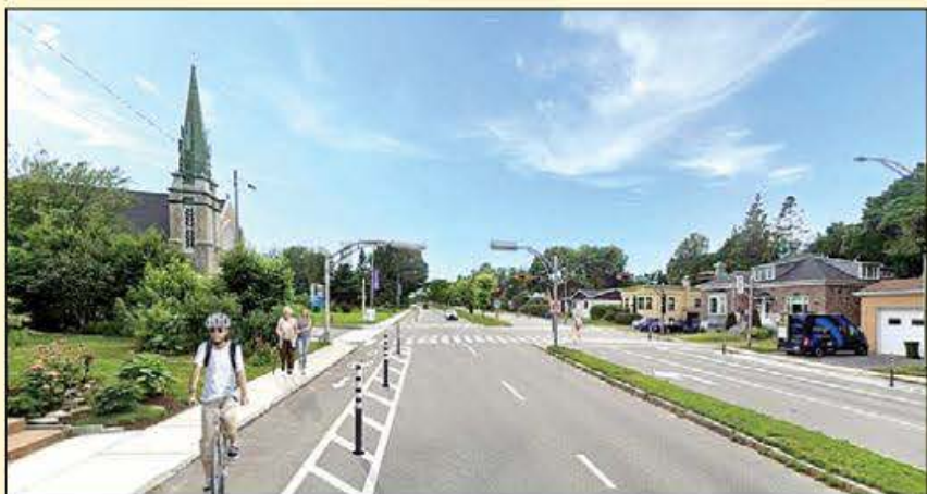
L'un des nouveaux liens cyclables, celui de 1,6 km entre les avenues des Gouverneurs et Marguerite-Bourgeois sur le boulevard Laurier.

Une expérience plus agréable pour tous les usagers de la route, peu importe le mode de transport choisi, donc une excellente nouvelle pour la mobilité dans la ville de Québec! ■