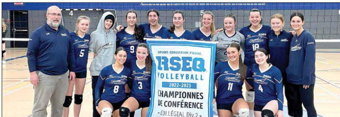
L'équipe en Volleyball féminin D2 se dirige donc fièrement vers les provinciaux, qui auront lieu à Baie-Comeau.