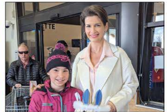
Les jeunes de la circonscription ont eu droit, eux aussi, à leur distribution de chocolat.