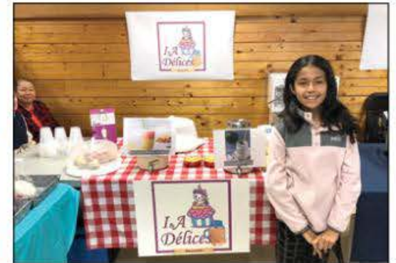
Une jeune entrepreneure très fière d'offrir ses produits.