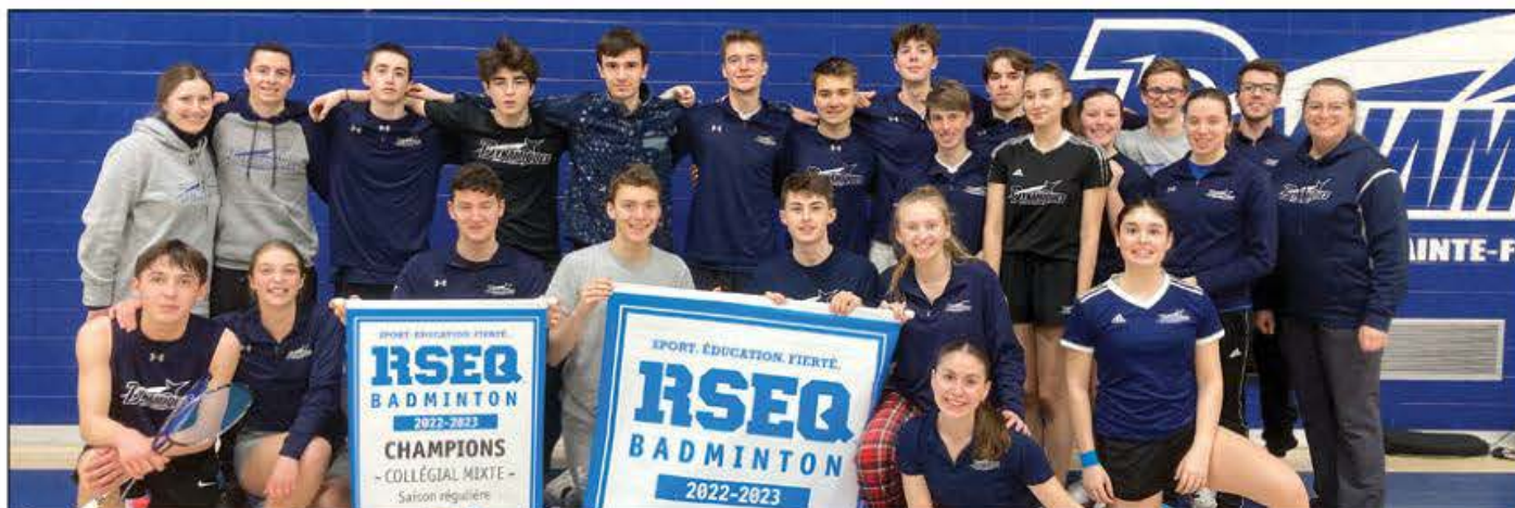
L'équipe de Badminton D1, déjà grande championne de la saison régulière, a remporté le titre de championne de la Conférence Nord-Est.