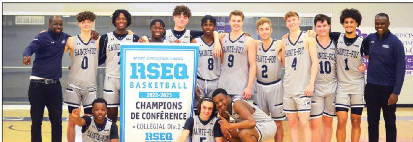
L'équipe masculine de Basketball D2 se classe au 1 er rang de sa conférence pour entamer les Championnats provinciaux, qui se tiendront à Alma.