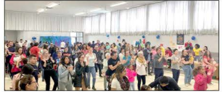
Près de 200 personnes ont participé à l'édition 2023 de la fête multiculturelle au Centre communautaire Claude-Allard.