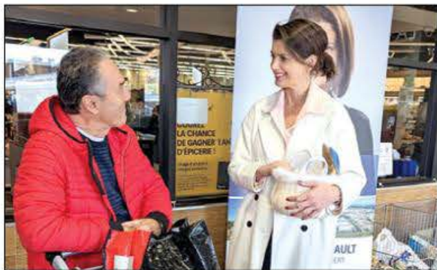
M me Geneviève Guilbault en discussion avec un citoyen de Louis-Hébert.