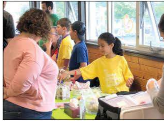
Les jeunes sont toujours très nombreux à participer à cet événement très formateur.

Pour en savoir plus sur le mouvement provincial: www.petitsentrepreneurs.ca et pour suivre les petites entreprises du Marché de Ressource Espace Familles: https://www.facebook.com/marcheREF . ■