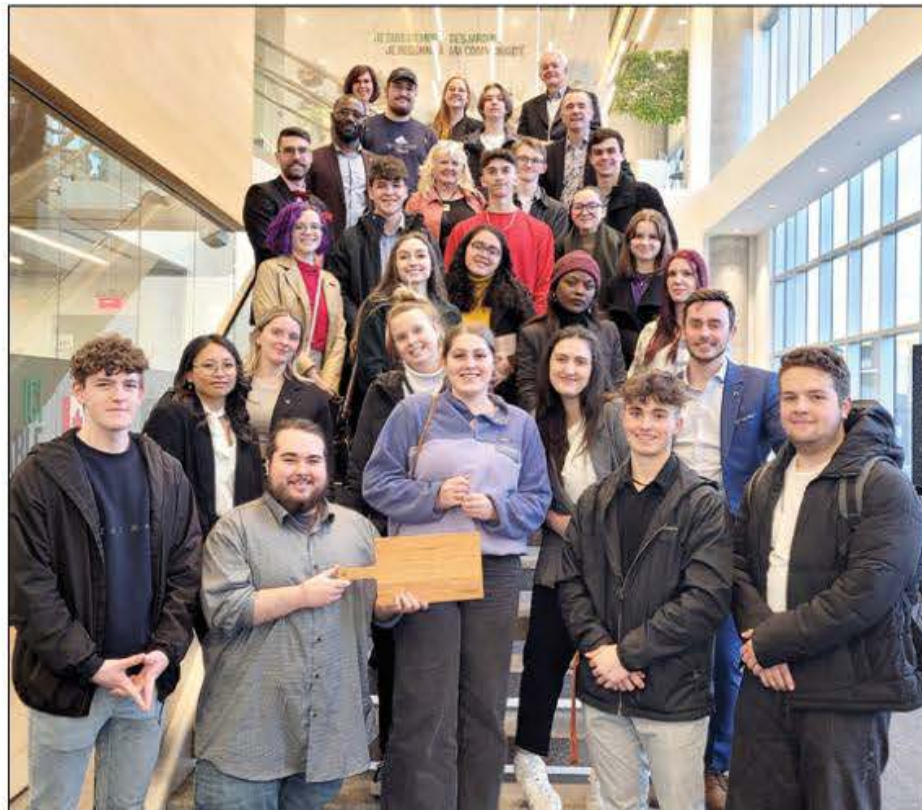
Les étudiants du programme Techniques de services financiers et d'assurances du Cégep de Sainte-Foy.