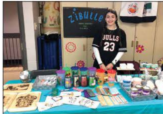
Les jeunes entrepreneurs font preuve de beaucoup d'imagination dans ce qu'ils proposent.