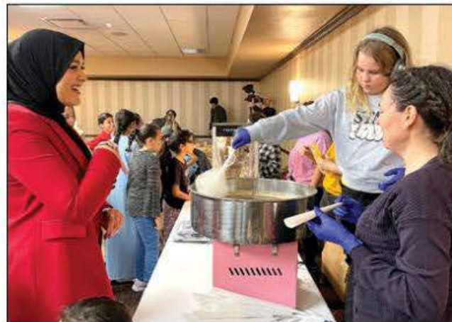
Au menu, Shawarmas, hot-dogs et soupe hrira accompagnés de nombreux gâteaux sucrés et salés cuisinés par les invités, soulignant ainsi l'importance du partage.