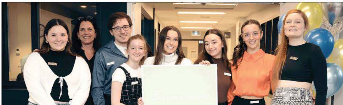
Étudiants et professeurs du programme de Techniques d'hygiène dentaire au Cégep Garneau.

(YG) Le Cégep Garneau a récemment procédé à l'inauguration de sa Clinique-école d'hygiène dentaire complètement modernisée. Un investissement de 13 M$ ont permis d'actualiser la clinique, les locaux de classe et les laboratoires, en plus d'acquérir de l'équipement à la fine pointe de la technologie comme des appareils d'empreintes virtuelles, deux imprimantes 3D, des simulateurs avec mannequin et de la radiologie numérique. L'équipe enseignante, les étudiants inscrits au programme de Techniques d'hygiène dentaire ainsi que leur clientèle profitent désormais d'un environnement d'apprentissage novateur et stimulant.