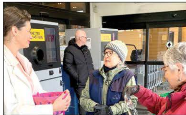
Des citoyennes partagent leurs préoccupations avec la députée de Louis-Hébert.