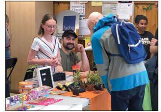
Les jeunes entrepreneurs sont souvent bien accompagnés par un parent ou un autre adulte.