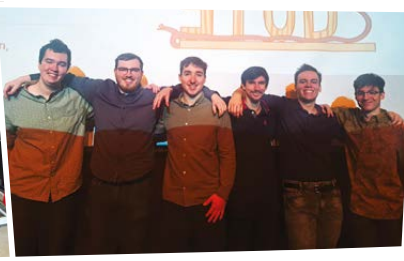
S.T.U.D.S Cégep de La Pocatière Bas-Saint-Laurent