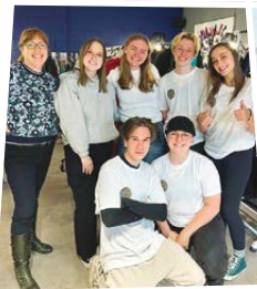
Troc Le Concept Cégep de l'Abitibi-Témiscamingue, Campus de Rouyn-Noranda Abitibi-Témiscamingue