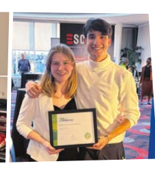
Média Communautaire Lavallois (MCL Média) Collège Montmorency Laval