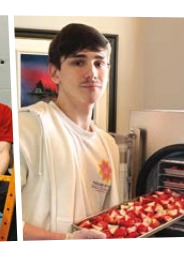
Sublyme - initiative contre gaspillage Cégep de Sherbrooke Estrie Lauréat national 1 er prix