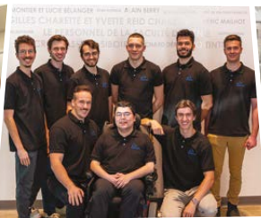
ExoFlex Université de Sherbrooke Estrie Lauréat national 2 e prix