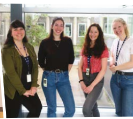
Le sexisme ordinaire, pas notre genre! Institut national de la recherche scientifique - Armand-Frappier Laval