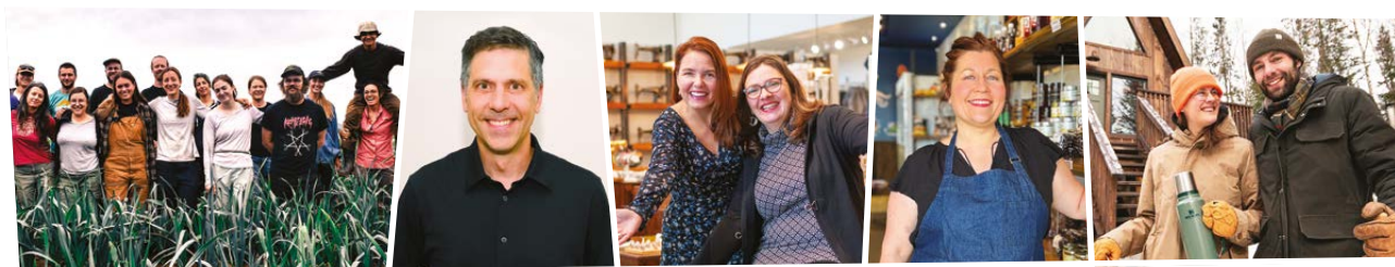
Ferme aux petits oignons Coop de solidarité Laurentides