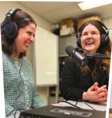
Balado Nuance Université Laval Capitale-Nationale