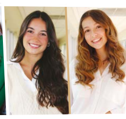
Tutorat Junior Université du Québec à Chicoutimi Saguenay-Lac-Saint-Jean