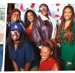
Cultur'elles MTL Université du Québec à Montréal Montréal Lauréat national 1 er prix