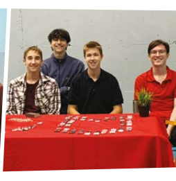
Unique Plastique Cégep de Lévis Chaudière-Appalaches Lauréat national 2 e prix