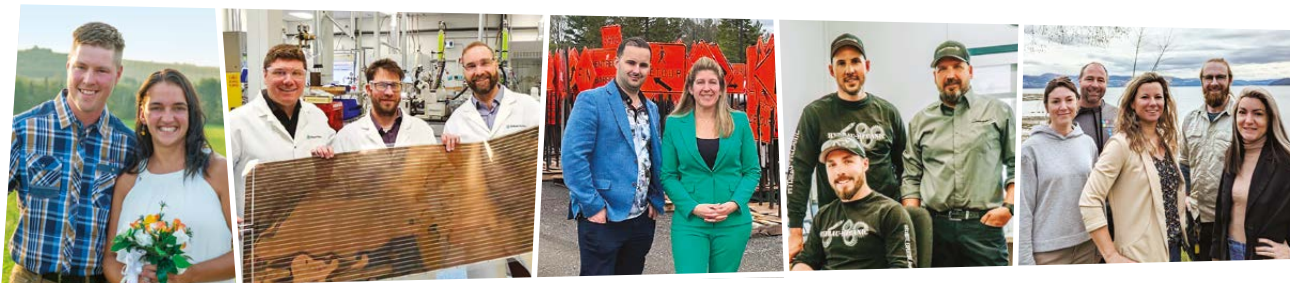
Ferme ViGo Bas-Saint-Laurent