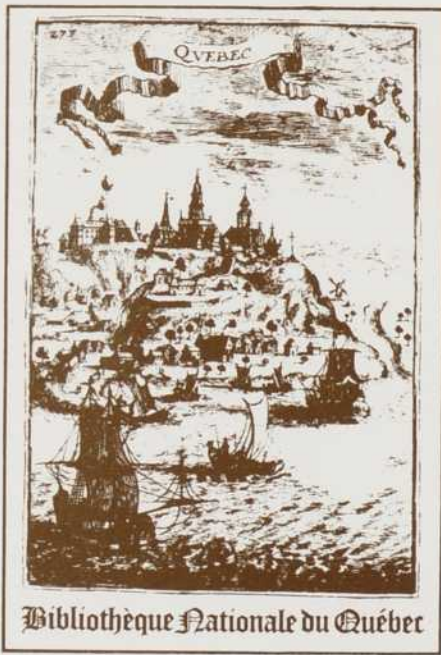
Bibliothèque Nationale du Québec

1777 1778 1779 1780 1781 1782 1783 1784 1785 1786 1787 1788 1789 1790 1791 1792 1793 1794 1795 1796 1797 1798 1799 1800