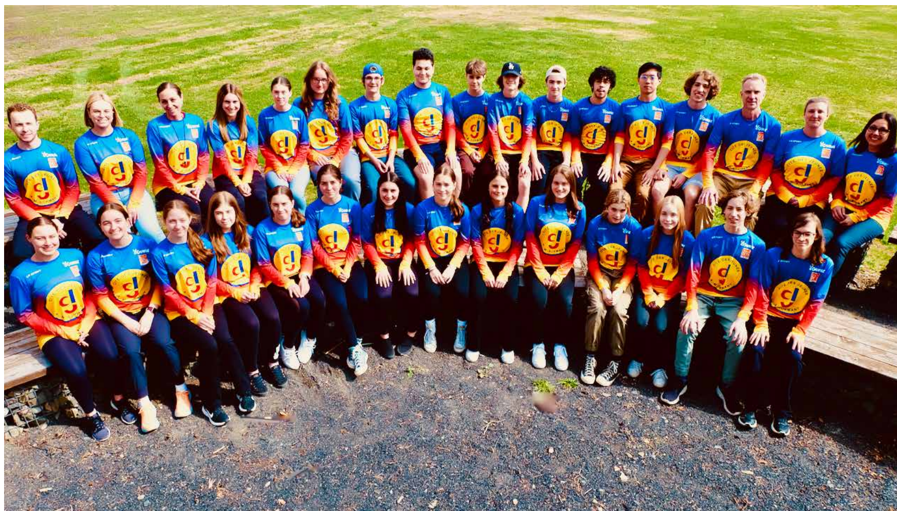
On peut apercevoir la délégation de la Cité des Jeunes A.-M.-Sormany, seule école hors Québec ayant participé à cette activité d'envergure.