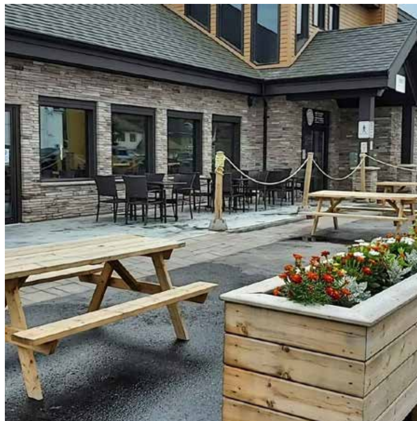
Le 3e Funk & Bier d'Edmundston aura lieu le 23 septembre prochain.

Par ailleurs, les détenteurs de billets de la Grande dégustation sont invités à se rendre sur le site aux alentours de 15h afin d'être prêts à profiter des festivités qui débiteront à compter de 16h.