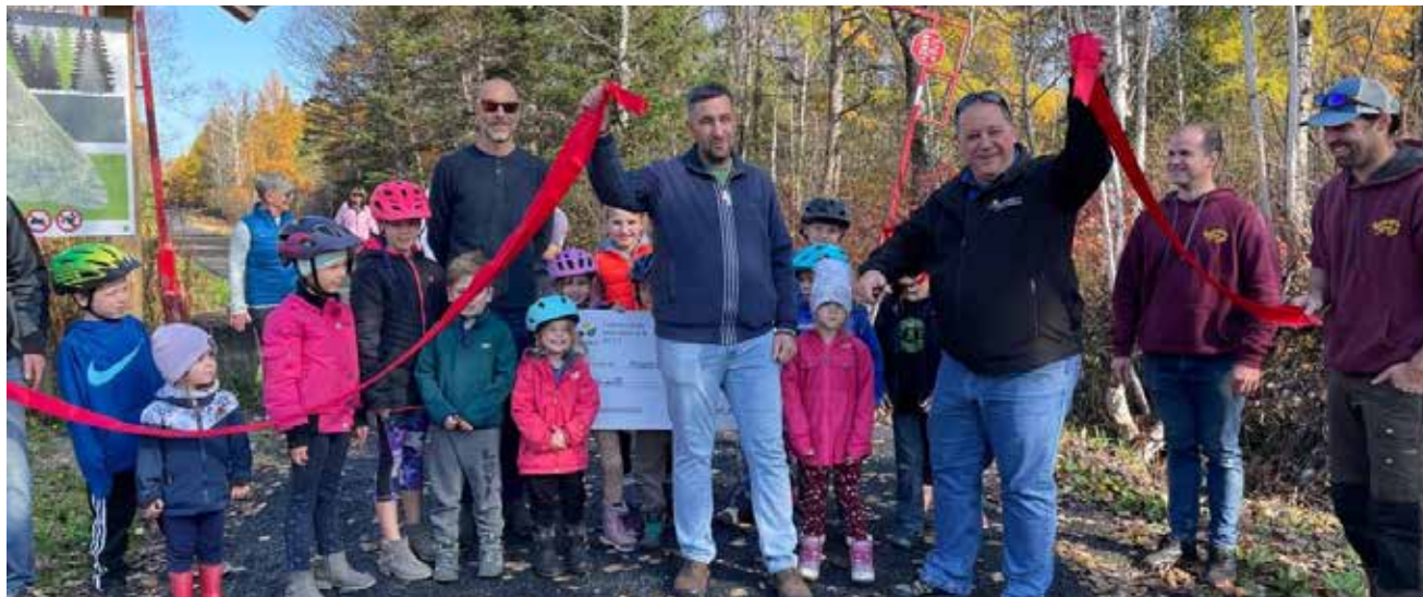
Cette photo a été prise l'an passé, lors de l'inauguration d'une installation ayant remporté le vote populaire, assorti d'un montant de 30 000 $, et ce, en marge du Budget participatif 2022. Photo contribution

« Cette belle initiative s'inscrit parfaitement dans notre démarche de Réalise Edmundston, dont le but premier est d'impliquer davantage