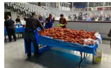
Un bel amonçement de homard pour le plaisir de nombreuses personnes qui attendaient impatiemment le retour de ce populaire souper-bénéfice.

Un total de 680 convives se sont réunis sur la patinoire du centre Jean-Daigle et ont pu savourer le délicieux crustacé. Tous les profits serviront à la création d'un fonds de bourses pour les étudiantes et étudiants qui fréquentent l'Université de Moncton, campus d'Edmundston.