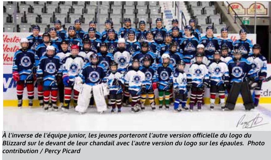
À l'inverse de l'équipe junior, les jeunes porteront l'autre version officielle du logo du Blizzard sur le devant de leur chandail avec l'autre version du logo sur les épaules.

L'équipe de hockey junior A, le Blizzard d'Edmundston, et le Club communautaire du hockey mineur d'Edmundston (CCHME), s'associent pour une période de cinq ans durant laquelle toutes les équipes du hockey mineur porteront le nom de «Blizzard», et ce, dès la saison 2023-2024.