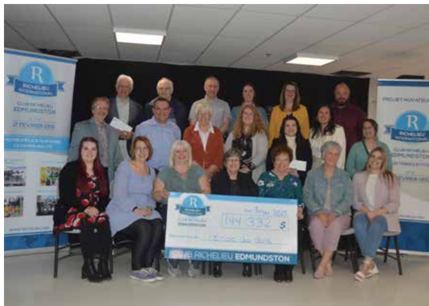
Voici les récipiendaires des dons remis en mai dernier par le Club Richelieu Edmundston.

À la fin de la soirée, le président du Club