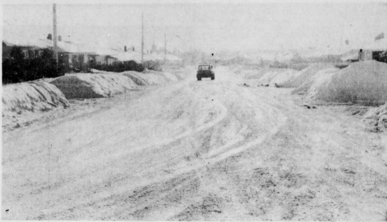
Selon certains contribuables amateurs des "lignes ouvertes" certaines rues de la municipalité ne seraient entretenues que trois ou quatre fois par année au moyen de la souffleuse. Cette photographie montre la 13e avenue à St-Noël.

En effet, les trois quarts des appels téléphoniques touchaient la question de la neige, soit la taxe qui porte ce nom ou la façon avec laquelle la neige était enlevée. En