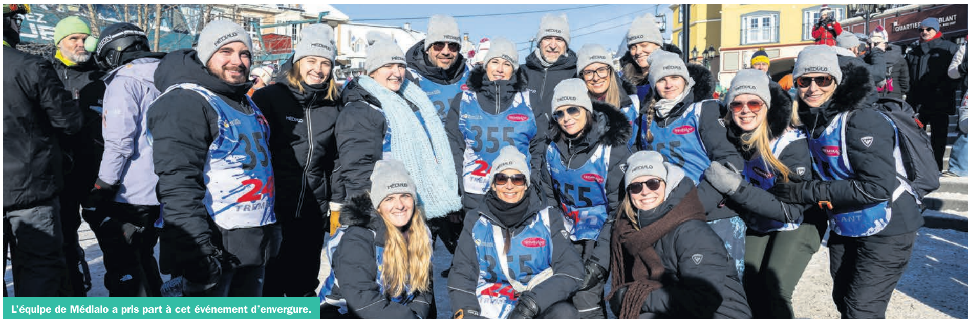
L'équipe de Médialo a pris part à cet événement d'envergure.