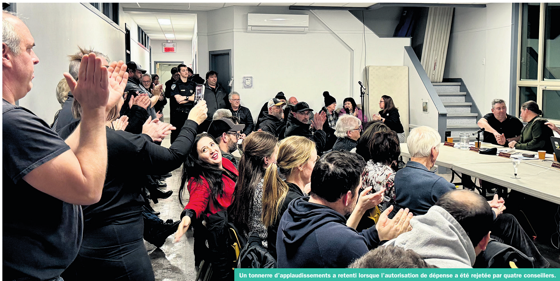
Un tonnerre d'applaudissements a retenti lorsque l'autorisation de dépense a été rejetée par quatre conseillers.