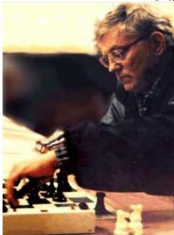
Igor Ivanov (2430) – Anatoly Karpov (2710) 14 e ch. soviétique par équipes, juillet 1979, 1 re ronde

Il fut donc l'un des plus forts maîtres internationaux de tous les temps.