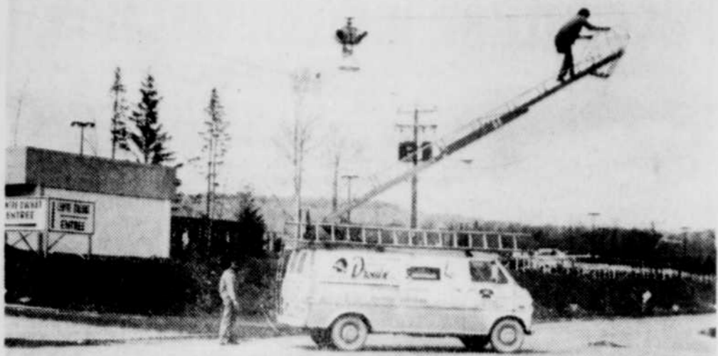
A la veille de l'ouverture du nouveau centre d'achats, on a procédé à l'installation d'un feu clignotant temporaire à l'angle des boulevards Ouellette et Smith. Ces lumières précéderont les feux complets de signalisation commandés depuis plusieurs mois, mais qui n'ont pas encore été livrés.