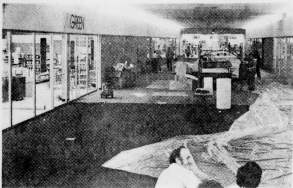
A l'intérieur du mail du nouveau centre d'achats de Carrefour Frontenac qui devait s'ouvrir ce matin, les ouvriers "de la dernière minute" s'affairaient fiévreusement hier après-midi pour compléter le gros des travaux.