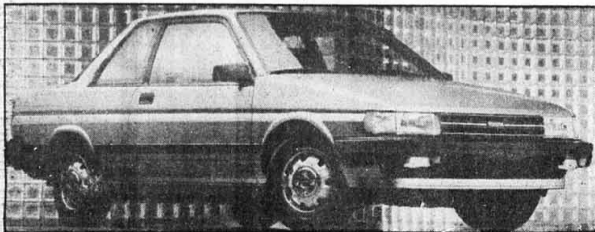
Cette nouvelle venue dans la famille des Tercel se distingue par son coffre volumineux et sa silhouette assez unique.

Or, soyez courageux et reprenez le volant le plus rapidement possible! Et rappelez-vous, un accident peut survenir une fois sans devenir une coutume!