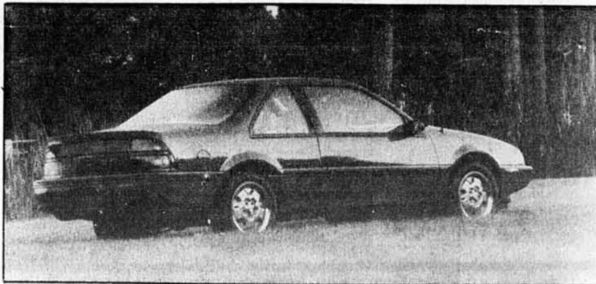
LA CHEVROLET BERETTA

La réponse appartient désormais au public. Rappelons que