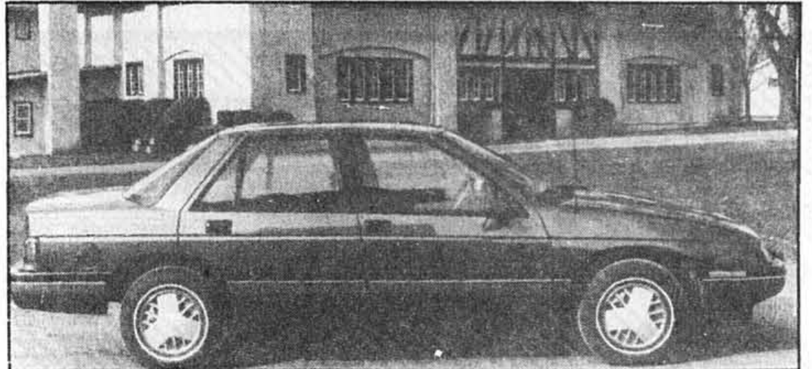
LA PONTIAC TEMPEST

La Pontiac Tempest est une berline aux formes nettement plus esthétiques. Elles tenteront de faire oublier les Phoenix et Celebrity de réputée mémoire.