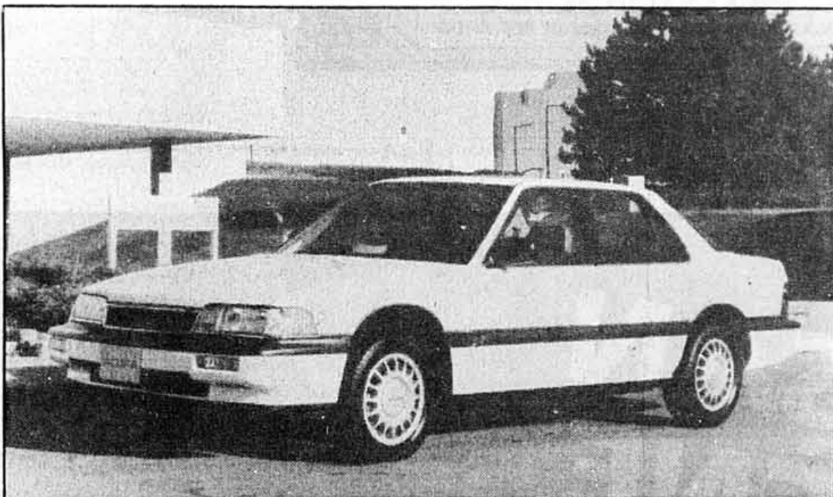
LA ACURA LEGEND

La Acura Legend est une voiture de grand luxe propulsée par un moteur V6 des plus sophistiqué. Plusieurs lui trouvent cependant une ressemblance trop grande avec la Honda Accord.