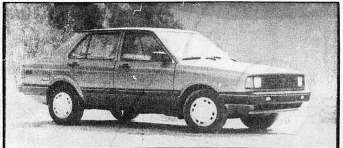
LA FOX DE VOLKSWAGEN

La Fox de Volkswagen est fabriquée au Brésil mais utilise le même moteur que la Golf. Elle est également disponible sous forme de familiale deux portes.