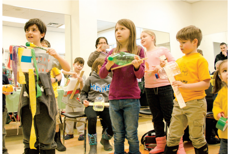
Des jeunes qui assistent à l'atelier « Jazz et recyclage. »

Le Festival Écolo est un événement écoresponsable d'une journée, dont les activités visent à rassembler sous un même toit