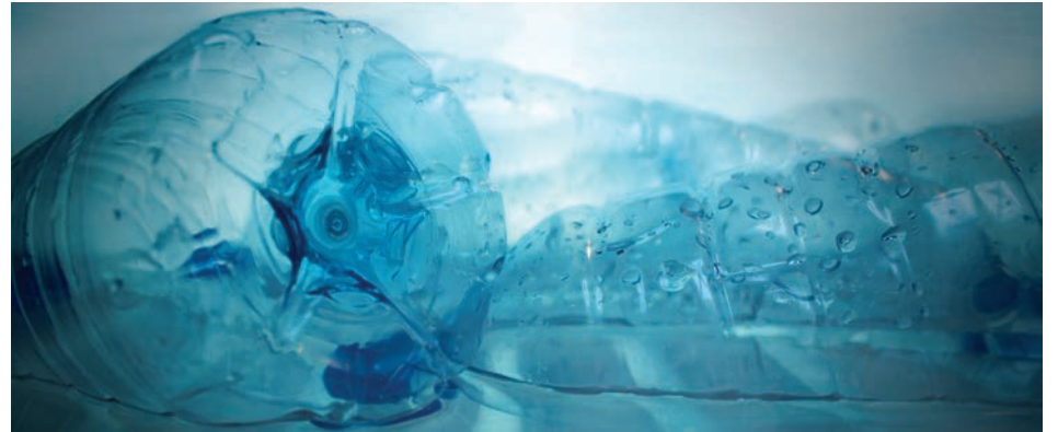
Les Québécois consomment un milliard de bouteilles d'eau par année.

La Ville n'est pas la seule à déployer des efforts; certains commerçants le font également de leur propre initiative. En effet, Uniprix Roxane St-Jean, sur la rue Montarville, deviendra le premier commerce de Saint-