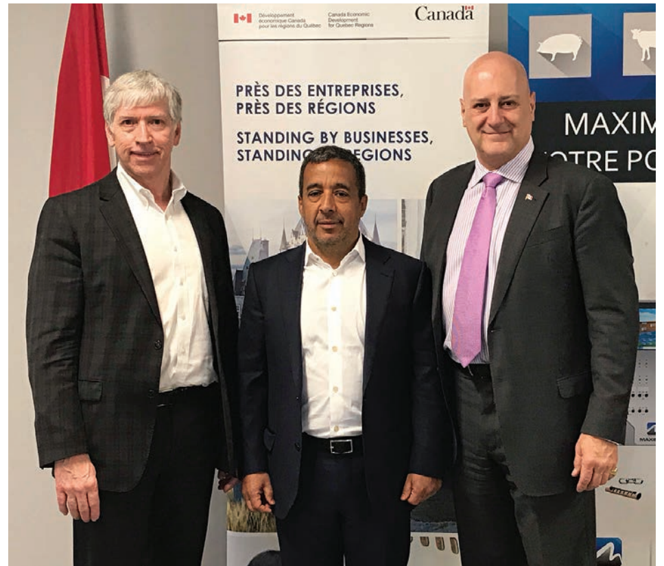
L'aide financière permettra à Maximus d'investir dans les technologies.

L'entreprise Maximus, située à Saint-Bruno-de-Montarville, a reçu une aide financière de 125 000 $ de la part du gouvernement fédéral.