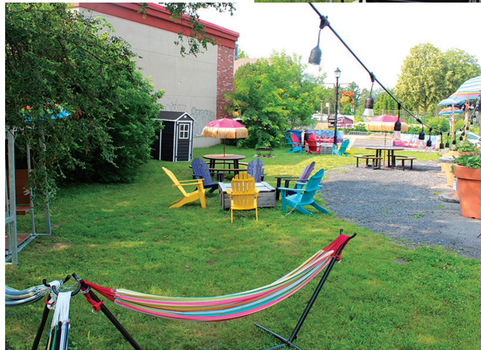
Le Parc éphémère est ouvert depuis le 9 juillet.

Une nouvelle activité pour les ados et jeunes adultes leur permettra de voir des films, là encore choisis par un sondage de la Ville en février sur un potentiel de huit. Une étoile est née le 19 juillet sur la place du Village et Aquaman le 9 août, et enfin 1991 , déjà diffusé le 5 juillet, ont été les choix de la plus grande majorité. « Les jeunes adultes sont invités à apporter leur chaise de parterre ou de camping et leurs grignotines favorites pour apprécier pleinement l'expérience! » préconise la municipalité.