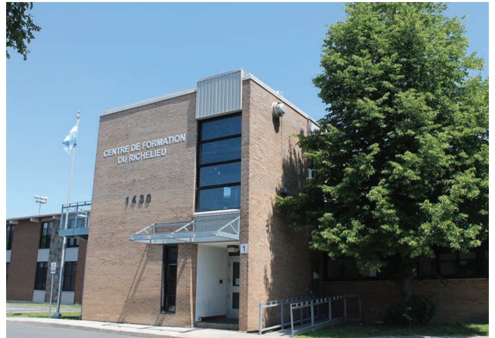
Le Centre de formation du Richelieu devient le Centre d'éducation des adultes des Patriotes.

La Commission scolaire des Patriotes (CSP) a annoncé récemment un nouveau nom et une nouvelle identité visuelle pour le Centre de formation du Richelieu (CFR). L'établissement situé à Saint-Bruno sera dorénavant appelé le Centre d'éducation des adultes des Patriotes (CEAP).