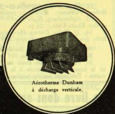
Aérotherme Dunham à décharge verticale.

Téléphones : bur. : 2-4256 — rés. : 5277