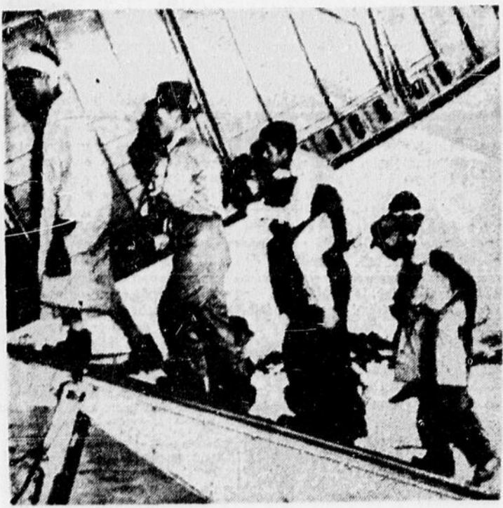
Blessé au cours de luttes sauvages dans les collines de Kumsong, sur le front central de l'Est, en Corée, ces soldats s'embarquent ou sont transportés dans la carlingue d'un avion "Globemaster" qui les amènera en arrière des lignes de feu. Kumsong est le seul endroit où se sont déroulés des combats majeurs et l'on rapportait un calme relatif dans les autres secteurs du front coréen, jusqu'à ce que l'armistice soit signé.