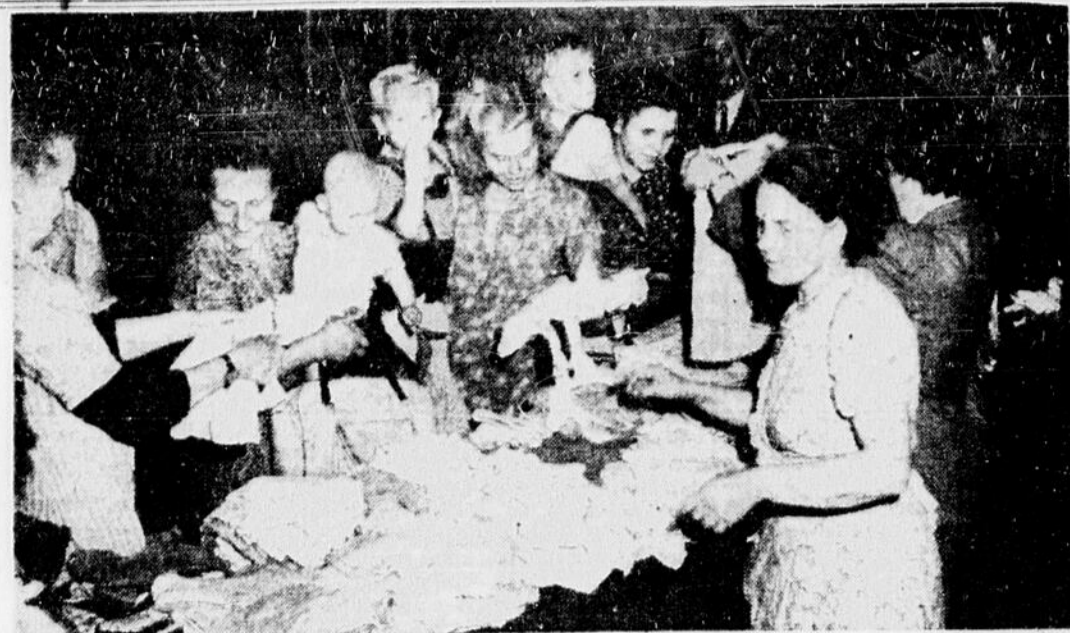
Maintenant que ses fonds de nourriture se sont épuisés, le maire Willi Kressman, dont les campagnes d'aide en nourriture lui ont fait une grande publicité, a choisi de poursuivre ses activités en fournissant des vêtements aux Berlinois de l'Est. Plus de 2,000 de ces derniers ont répondu à son invitation, exprimée