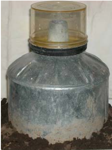
Dans le maïs