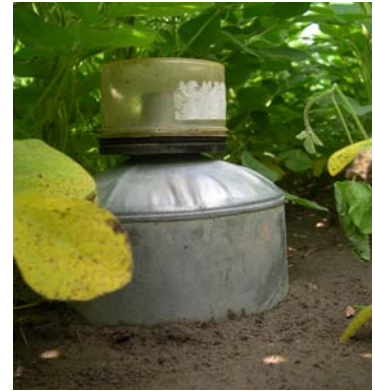
Dans le soya