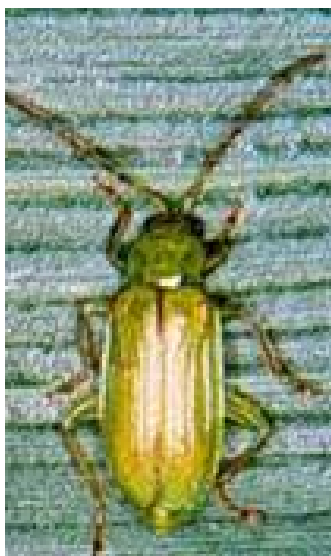
Figure 1. Chrysomèle des racines du Nord