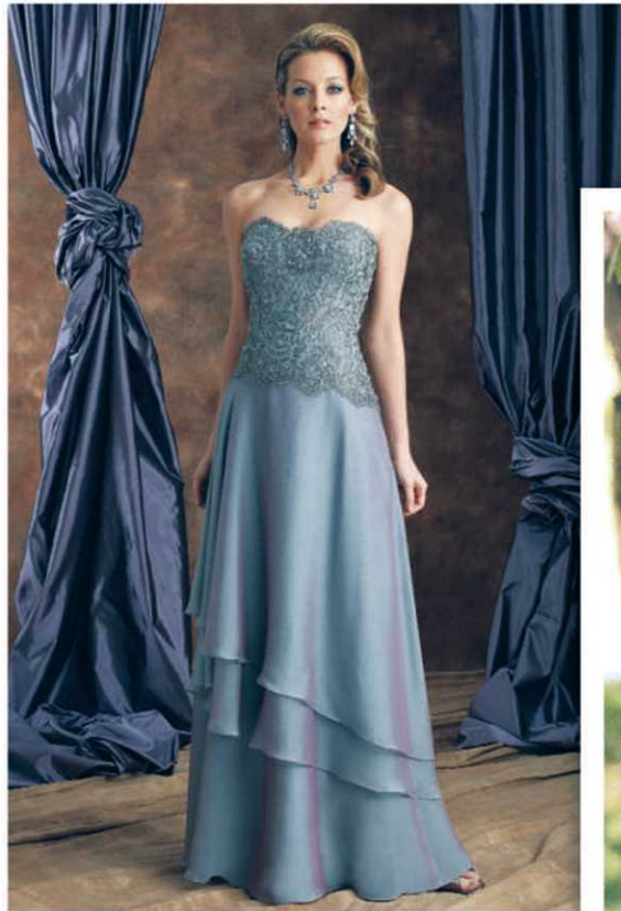
Chouchou des stars, la robe à bustier passe du tapis rouge au cortège nuptial. Collection Maison Victoria.

Bien que le complet et le tuxedo évoluent moins rapidement que la robe de la mariée, il est tout de même possible de dénicher un costume qui combinerait l'élégance classique et une touche actuelle. Tout est une question de coupe. Suivant les tendances mode