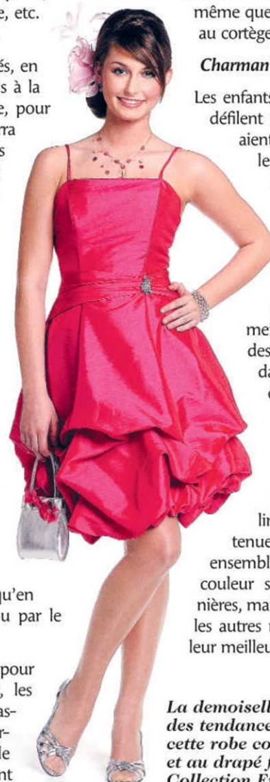
La demoiselle d'honneur s'inspire des tendances mode, comme sur cette robe cocktail à l'ourlet ballon et au drapé flatteur à la taille. Collection France B. Pronuptia.

Enfin, les mères des mariés seront elles aussi des plus élégantes. Mais pas de robe de soirée, ni de crinoline pour elles. On privilégiera une tenue de prêt-à-porter chic, souvent un ensemble deux-pièces, dont le tissu et la couleur s'inspireront des tendances saisonnières, mais avec une coupe classique. Comme les autres membres du cortège, elles seront à leur meilleur lors de cette journée si spéciale.