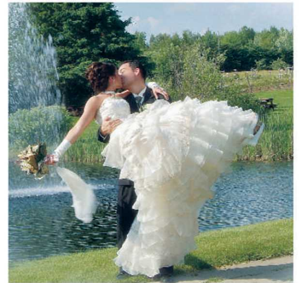
Un endroit enchanteur pour une journée mémorable.

La journée du mariage est souvent un moment privilégié que les mariés s'offrent entre eux et qu'ils désirent partager avec leurs familles et amis. Pour