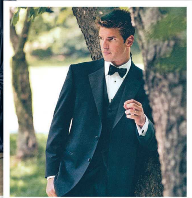
Élégant et classique, le tuxedo du marié épouse sa silhouette. Collection Maison Victoria.