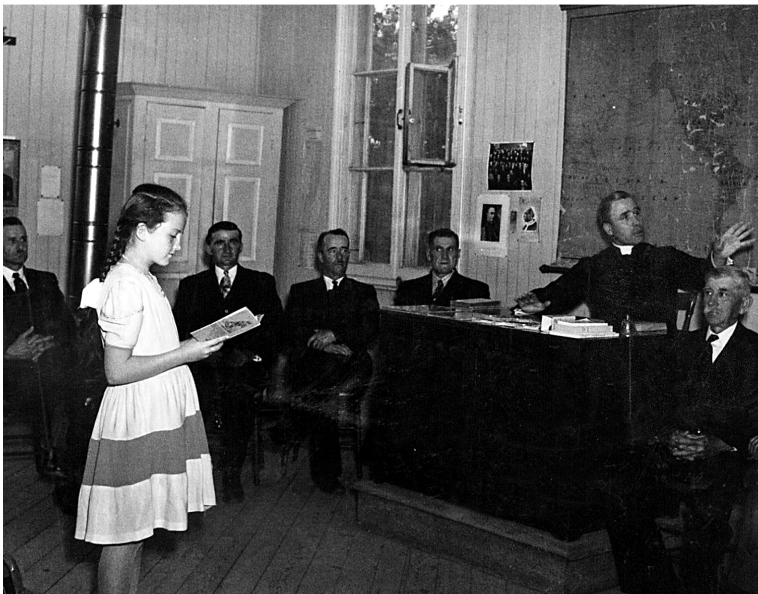
De confessionnel, le système public d'éducation est devenu laïque. Cette mutation a été réalisée entre autres grâce à des religieuses et des religieux qui, pour respecter la diversité des élèves et des parents, se départaient de leurs costumes religieux et de tous signes religieux ostentatoires. Sur cette photo non datée, une écolière passe un examen devant un frère à l'école de Saint-Pierre, à l'île d'Orléans.

fut la prise de conscience, au cours des années 1960 et 1970, de la diversité des convictions en matière de religion dans la population québécoise. Et cela non seulement à cause de l'immigration. Car, surtout, on se rendait compte que les Canadiens français ne formaient plus une communauté catholique homogène comme on l'avait cru longtemps (en dépit du fait qu'elle comptait toujours des athées, des agnostiques, des anticléricaux). Cette réalité plurielle a éclaté lorsque, en 1960, se créa le Mouvement laïque de langue française (MLF), qui réclama le respect des convictions des non-croyants tout autant que des croyants dans toutes les institutions publiques. En particulier, le MLF demandait qu'on crée un réseau d'écoles publiques non confessionnelles, donc laïques, de langue française, pour accueillir les enfants de parents qui ne voulaient pas inscrire leurs enfants dans des écoles religieuses.