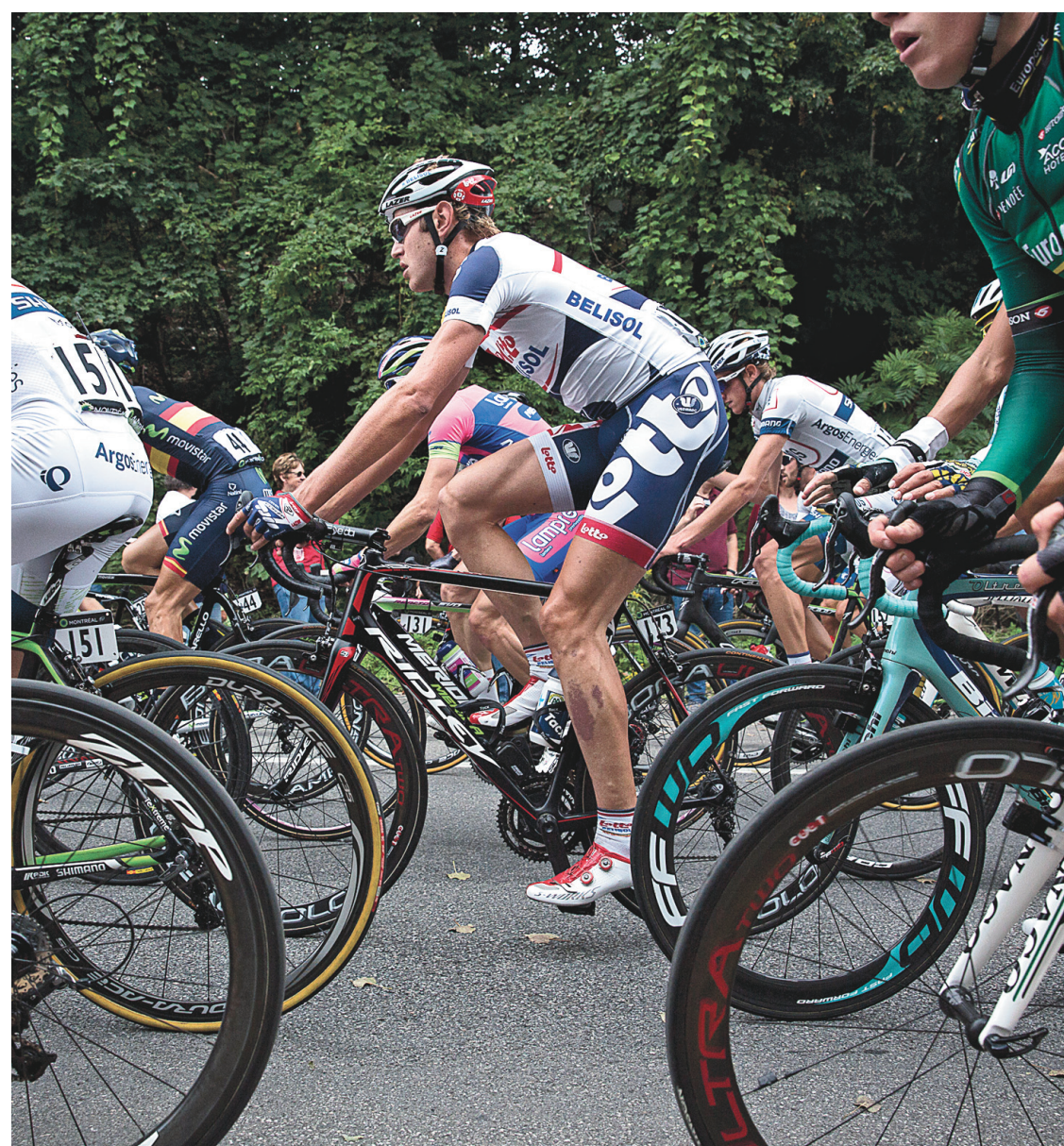
FRANÇOIS PESANT LE DEVOIR

Au terme de 17 boucles sur le mont Royal totalisant 205,7 km, le Slovaque Peter Sagan a enlevé l'épreuve montréalaise.