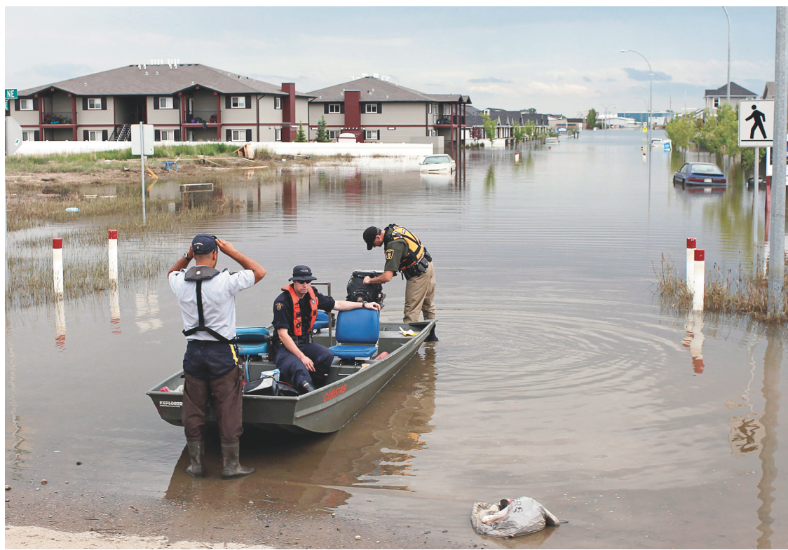
La crue de rivières dans le sud de l'Alberta, cet été, a entraîné des frais de 2,25 milliards pour les assureurs privés.