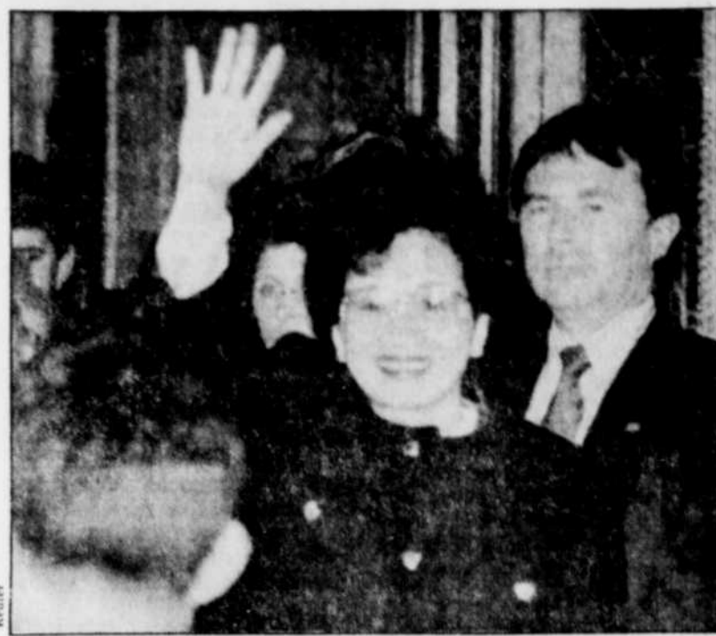
La présidente des Philippines saluant la foule, hier, à Toronto.

Les ententes qui doivent être signées, aujourd'hui, à Ottawa, comprennent entre autres un programme d'aide de 56 millions $ pour des projets de développement social, comme les routes.