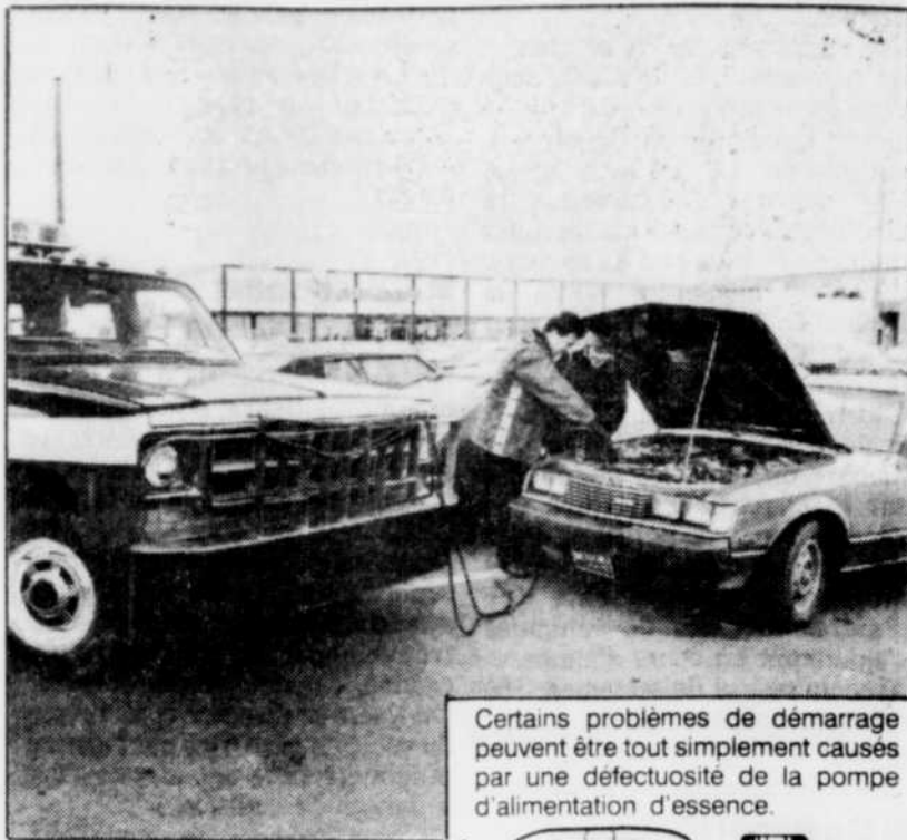
Certains problèmes de démarrage peuvent être tout simplement causés par une déficience de la pompe d'alimentation d'essence.

R. Un pignon fixé au bout de l'arbre de direction (actionné lorsqu'on tourne le volant) déplace la crémaillère, une longue barre dentée montée en travers de l'auto dont les extrémités sont raccordées aux biellettes de direction. Le volant fait tourner le pignon de l'arbre de direction qui déplace la crémaillère vers la gauche ou la droite, d'une butée à l'autre. Il s'agit du principe de direction le plus simple parmi ceux utilisés.