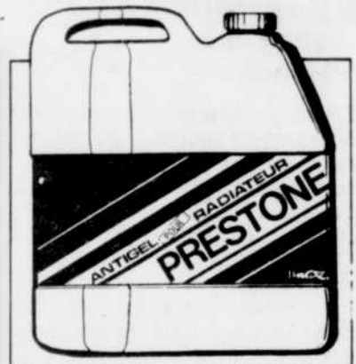
Le niveau d'antigel dans votre véhicule varie avec la température du moteur.