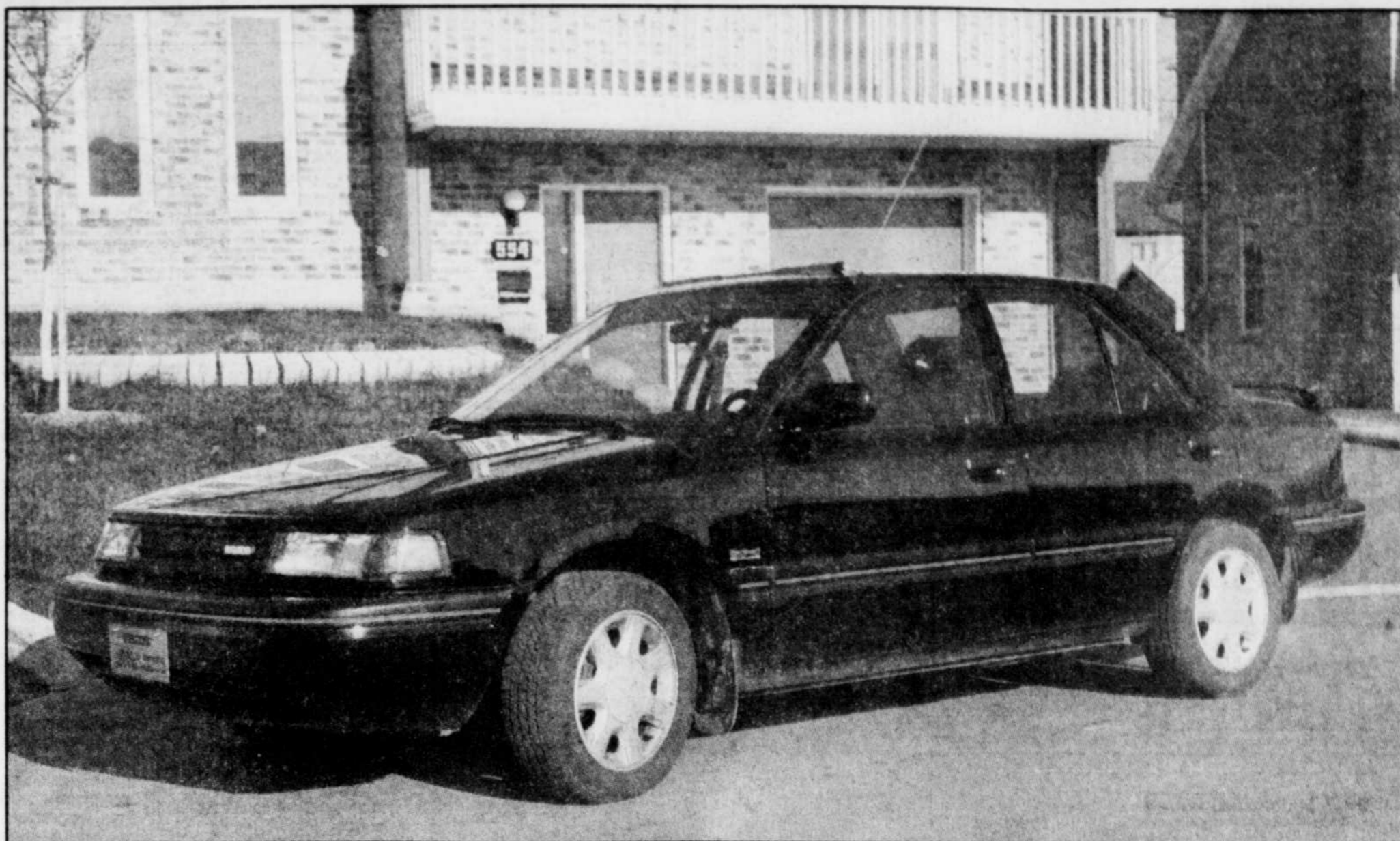
La Protégé de Mazda est une version berline de la 323 destinée à rivaliser avec la Corolla de Toyota.