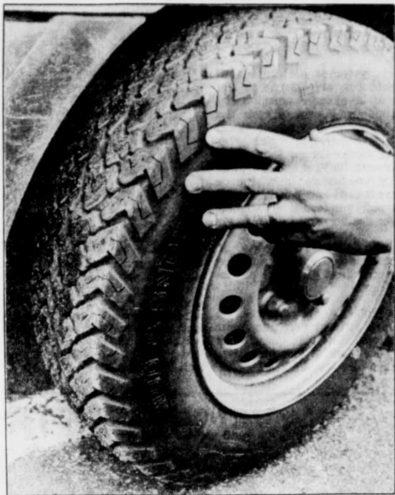
La pression d'air des pneus devrait être vérifiée au moins une fois par semaine.

R. Certains véhicules sont munis d'un interrupteur de pompe d'alimentation d'essence. En cas d'impact, cet interrupteur arrête la pompe à essence coupant ainsi l'arrivée de carburant au moteur, ce qui réduit les risques d'incendie. Dans votre cas, probablement que quelqu'un a heurté l'arrière