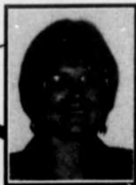
par SYLVIE MANTHA

Les conclusions des statistiques officielles et des sondages de victimisation démontrent que les personnes âgées sont moins victimes de crime que les gens d'autres groupes d'âges. De plus, la criminalité dénoncée par ces derniers est presque exclusivement composée de crimes contre les biens. Toutefois, en matière de victimisation criminelle, et dans le cadre de l'approche communautaire, il importe beaucoup plus de se pencher sur le phénomène de la peur du crime que sur celui de la victimisation réelle et de ses conséquences. Les aînés sont ceux qui souffrent le plus du phénomène de la peur bien qu'ils soient statistiquement moins susceptibles d'être victimes d'un acte criminel que les gens d'un autre groupe d'âge. En effet, les personnes âgées, qu'elles aient été victimes ou non, se sentent vulnérables face au crime; elles ont peur. Elles appréhendent tout type de crime, mais celui qui leur fait le plus peur est l'agression physique. Cela s'explique par leur difficulté à se défendre.