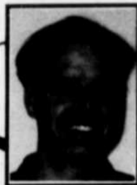
par DAVID LECLERC