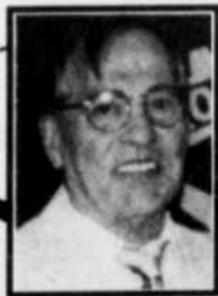
par ADÉODAT ROSS

Votre voiture est un investissement considérable. Il est donc important de prendre au moins quelques précautions élémentaires afin d'éviter de vous la faire voler. Un système antivol électronique pour votre voiture serait la protection idéale. Mais à défaut d'un tel dispositif, quelques mesures de précaution pourraient vous éviter bien des ennuis. Veillez à toujours verrouiller les portières de votre véhicule, qu'il soit stationné sur la rue, dans un stationnement public, ou encore dans votre entrée de cour. Il ne faut que très peu de temps à un voleur aguerri pour déverrouiller vos portières. Cependant bien des vols sont commis par de jeunes amateurs qui ne désirent que vous «emprunter» votre automobile pour s'amuser et l'abandonner ensuite Dieu sait où et dans quelle condition. Ne leur facilitez pas la tâche en laissant vos portières déverrouillées ou, encore pire, les clés dans le contact.