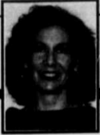
par JOHANNE BUISSIÈRES