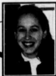
par VÉRONIQUE MOFFET