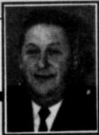
par LUC NAULT

Afin de mieux desservir les membres Prévol, les secteurs ont été redivisés. L'objectif est, dans un premier temps, d'harmoniser les secteurs Prévol à ceux du Service de police et dans un deuxième temps, de diffuser des renseignements relatifs aux secteurs environnants de chaque membre. Ainsi, un secteur a été ajouté, ce qui porte le nombre de 7 à 8. De plus, les secteurs seront dorénavant identifiés par un nom plutôt que par un numéro. En consultant la carte ci-dessous, vous pourrez reconnaître votre secteur. Enfin, il est à noter que chaque famille membre recevra la carte de son nouveau secteur et que cette modification sera en vigueur à partir du 15 novembre. Nous espérons que ces modifications répondront à vos attentes.