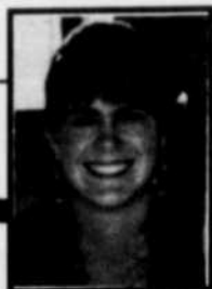
par ÉLAINE CÔTÉ