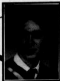
par LOUIS-SAMUEL BUISSIÈRES- PIETTE

Verre cassé, tables à pique-nique renversées et brisées, tessons de bouteilles, déchets éparpillés... C'est à peu près ainsi que nous avons trouvé les lieux quand, par une chaude matinée de juillet, l'équipe de sauveteurs et moi-même avons commencé notre journée de travail à la plage du parc Moussette.