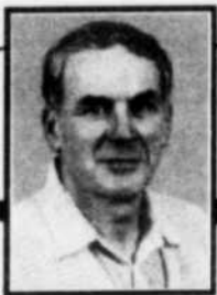
par ROGER LEGROS

Lorsqu'on entend parler de vols divers et de cambriolages, on est toujours porté à croire que cela n'arrive qu'aux autres. C'est ainsi que Prévot fut mis sur pied afin de sensibiliser les gens à protéger leurs biens et leur résidence. Des conseils pratiques de prévention vous sont offerts par ce programme, à chaque semaine, dans le but de décourager les voleurs et de réduire le nombre de cambriolages... bref, éviter d'avoir de malheureuses surprises lors du retour à la maison.