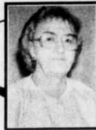
par GISÈLE POULIN

Il est souvent trop facile de juger les jeunes d'aujourd'hui pour tout ce qui se passe dans notre milieu. Il faut regarder la société dans laquelle nous vivons et qui laisse parfois à désirer. La situation familiale des jeunes a, dans certaines circonstances, un impact important sur le comportement des adolescents. Les familles monoparentales ont donc tout un défi à relever à ce chapitre. De plus, les messages transmis par la télévision, la radio et les journaux faussent souvent la réalité et encouragent les jeunes à la violence. Ce n'est pas facile d'être jeune de nos jours. C'est même très difficile. Il faut donc tenter de les écouter, de les supporter et de les orienter vers de bonnes décisions.