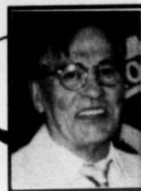
par ADÉODAT ROSS

A l'approche de la période des Fêtes et particulièrement en période d'austérité comme celle que nous traversons, les voleurs seront très actifs d'ici la période des Fêtes. Il faudra donc redoubler de prudence afin de ne pas être victime de leurs activités.