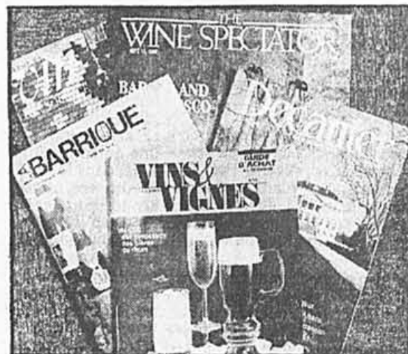
La Barrique, Vins & Vignes, Decanter, Revue du vin de France, The Wine Spectator, les cinq revues les plus lues au Québec.

Bi-mensuel, The Wine Spectator , de San Francisco, est sans aucun doute la meilleure et la plus riche source d'informations existante sur l'actualité viti-vinicole. A cause de son rythme de parution, mais aussi en raison de la multiplicité des