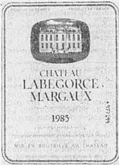
VIN ROUGE 750 ml REG. WINE 11.5% alc/vol

L'un de ces vins, le Mas de Daumas Gassac, vendu maintenant très cher (plus de $42 pour le 1985), est un rouge déjà connu par un certain nombre