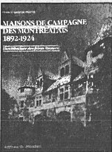
MAISONS DE CAMPAGNE DES MONTRÉALAIS 1892-1924