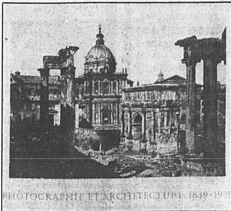
PHOTOGRAPHIE ET ARCHITECTURE 1839-1939