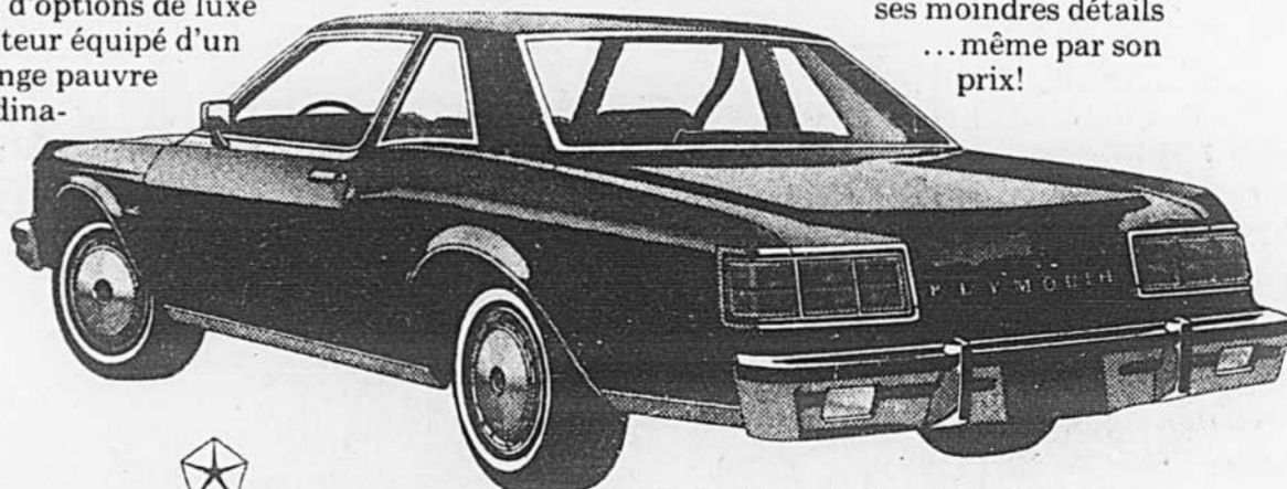
Sportive Plymouth Caravelle hardtop 2 portes

Oui, vous constaterez facilement que la Plymouth Caravelle est dans la note par ses moindres détails... même par son prix!