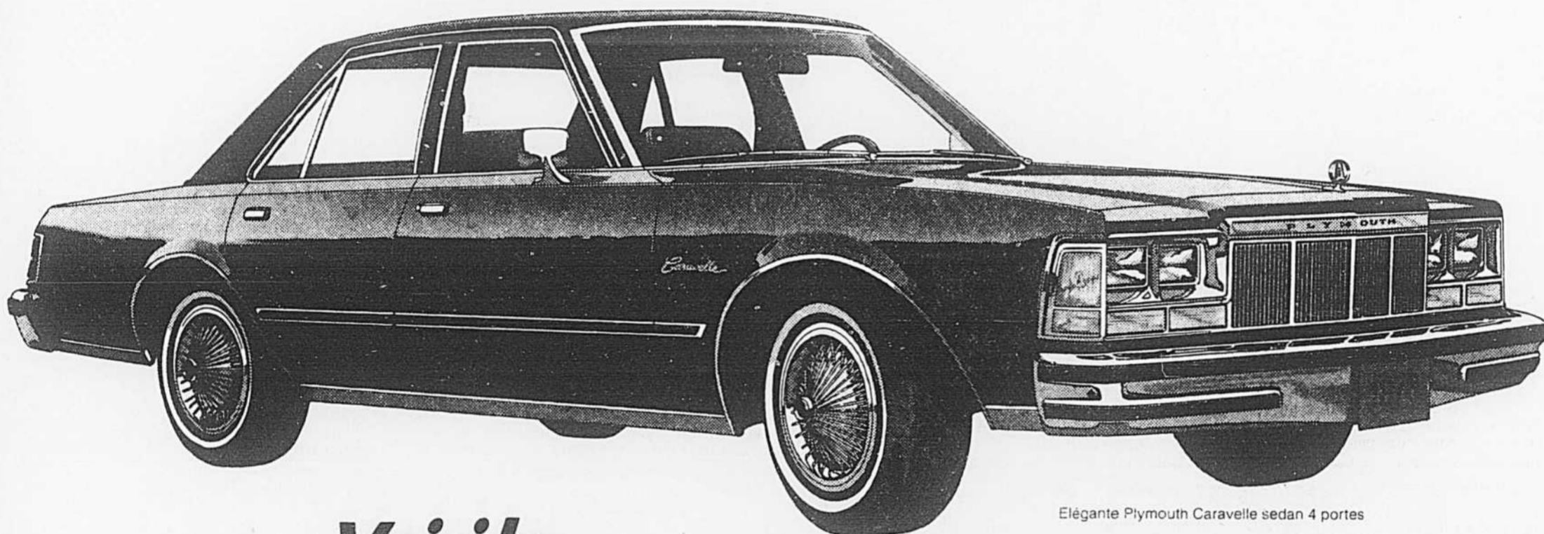
Élégante Plymouth Caravelle sedan 4 portes

Dans la note par sa taille, son élégance, son prix.