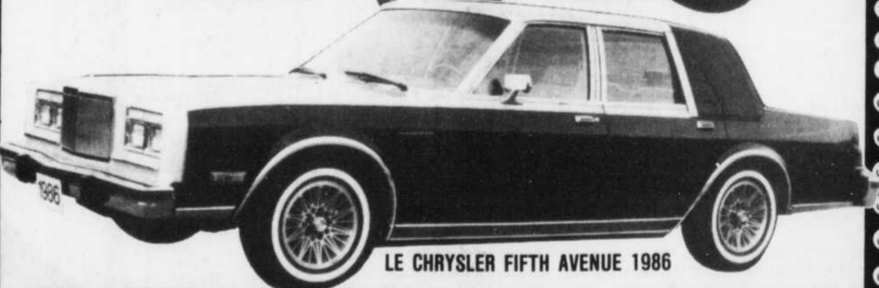
LE CHRYSLER FIFTH AVENUE 1986