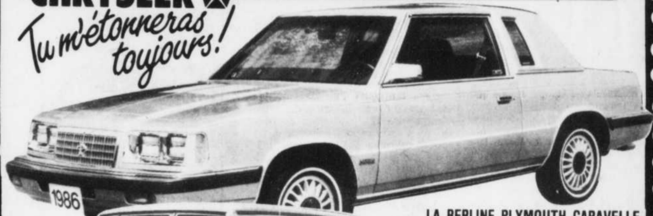
LA BERLINE PLYMOUTH CARAVELLE DEUX PORTES 1986