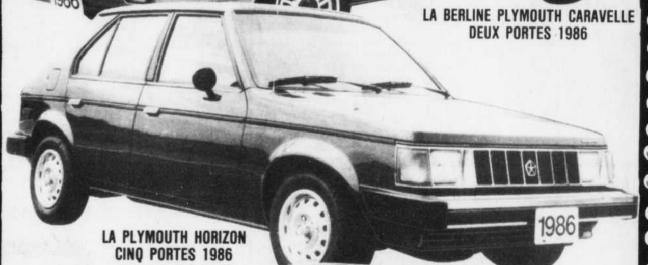
LA PLYMOUTH HORIZON CINQ PORTES 1986