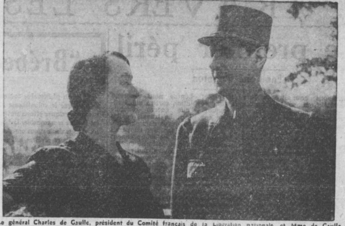
Le général Charles de Gaulle, président du Comité français de la Libération nationale, et Mme de Gaulle.

Le village de Richmond, situé à peu près à 20 milles d'Ottawa, doit son nom au 4e duc de Richmond, le même qui, avec sa femme, la duchesse de Richmond, donna un fameux bal à Bruxelles, Belgique, la veille de la bataille de Waterloo, le 18 juin 1815.