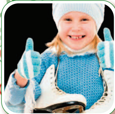
Patin rythmé p. 8