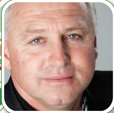
Discours du maire p. 3