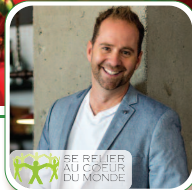
Soirée conférence p. 10