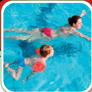
Horaire des bains libres p. 9